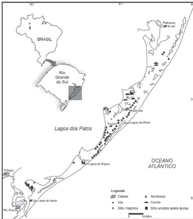
Fig.01: Mapa da porção central costeira do Rio Grande do Sul, Brasil, assinalando os sítios arqueológicos