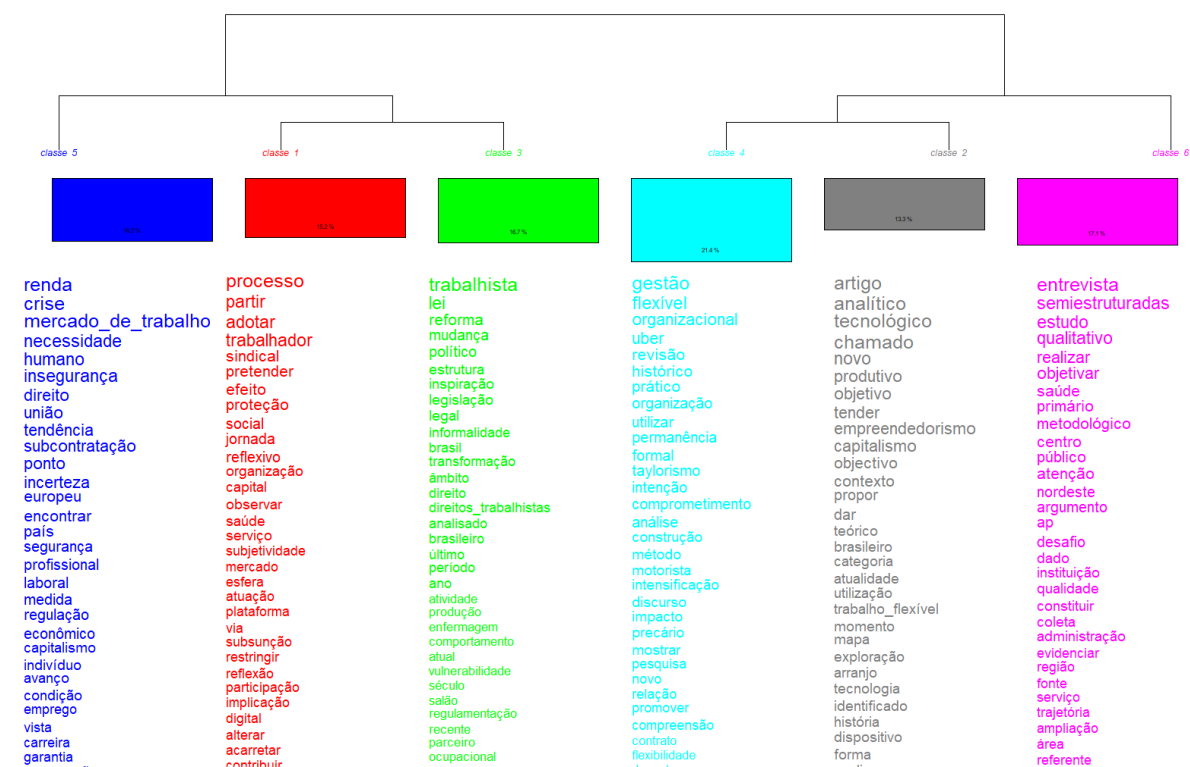
QUADRO 2 – CLASSIFICAÇÃO HIERÁRQUICA DESCENDENTE (CHD)