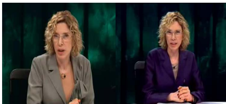
Fig 2: Plano próximo e médio no início dos programas em análise.

tensão e firmeza características intrínsecas à própria lógica do programa, que desenvolve um jogo tenso. O efeito de sociabilidade no plano médio, logo no início, é também uma das características do programa, que promove redes de convívio social, pelas quais faz circular informações que exprimem os interesses e opiniões da apresentadora. Ao se reportar aos telespectadores, a apresentadora desenvolve sua forma de sociabilidade, simulando uma comunicação face a face, a partir do uso do eixo Y-Y (olhos nos olhos). Essa opção filmica parece, então, associada a um movimento de referenciação, a uma operação destinada a desficcionalização do discurso. É quando a apresentadora nos lembra: “eu estou aqui e falo agora com vocês”. Se considerarmos que a realidade supõe a presença (espaço/tempo) e que só é plenamente real o aqui e agora (ODIN, 2000), a apresentadora vai exercer a função de ancoragem do discurso no real da atualidade – um operador de realização (VÉRON, 1983), na tentativa de “neutralizar” ao máximo o estatuto ficcional inerente a todo discurso.