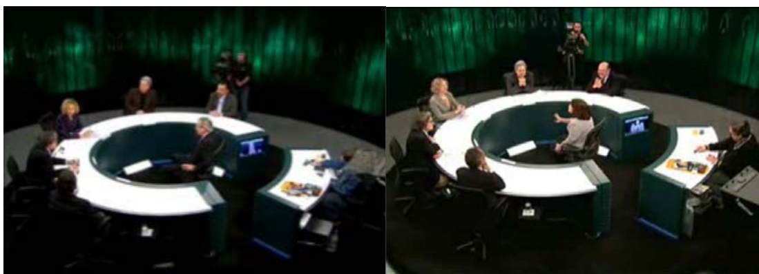
Figura 1: Disposição concêntrica

Os participantes estão dispostos em círculo, porém essa disposição não produz um efeito de parceria; ao contrário, promove o distanciamento entre o convidado e debatedores/mediadora, deixando de lado o caráter de proximidade.