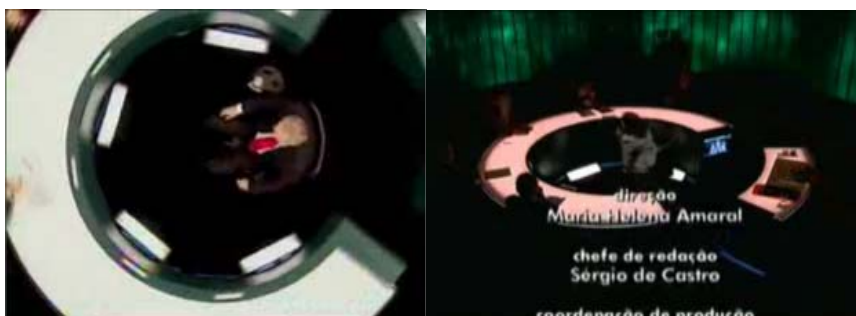
Fig 4: Encerramento do programa Roda Viva sob o plano geral.

filmagem, ao entrevermos os câmeras que se movimentam na penumbra, evidenciando o estatuto fílmico do programa (figura 4).