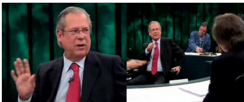
Fig 3: Plano próximo e americano, respectivamente.

A figura 4 ilustra o encerramento do programa. Nesse momento, há um movimento circular da câmara de baixo para cima, o entrevistado ao centro vai se afastando ao ritmo do giro da roda. A imagem do cenário em movimento remete-nos à imagem do jogo de roleta em que nunca sabemos o que está por acontecer, onde e quando ela vai parar. O giro da câmara deixa subentendido certa passividade dos participantes, todos estão em situação de igualdade, sendo movimentados ao léu pela roda. No entanto, evidencia-se o papel central do entrevistado: celebridade e vítima. É a seu redor que gira a roda e é ele que não sabe onde e em que momento ela vai parar e o que ela lhe reserva (uma menção aqui também a roda da fortuna comandada pelas moiras da mitologia grega).