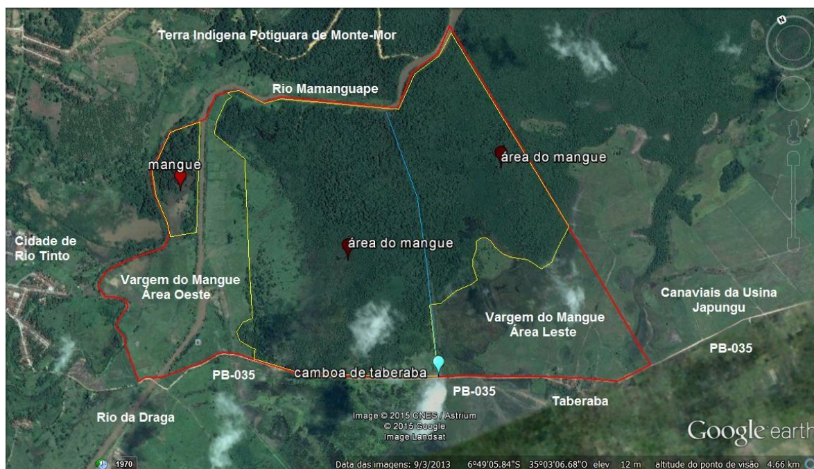
Figura 4: Imagem de satélite mostrando a área de ocupação da Vargem do Mangue, podendo-se observar à esquerda parte do núcleo urbano de Rio Tinto. O polígono delineado em amarelo indica a área do imóvel em litígio, de 517 hectares, segundo dados do Incri, de 2004.

A área ocupada há décadas pelo grupo social em estudo para suas atividades de subsistência – agricultura familiar e pequena criação de gado – localiza-se à margem direita do Rio Mamanguape, tendo a oeste o referido rio (que nesse trecho é estreito e de pouco volume de água, já que o volume maior foi canalizado para o “Rio da Draga”), ao norte e ao leste uma área de mangue e ao sul a rodovia não-pavimentada PB-035.