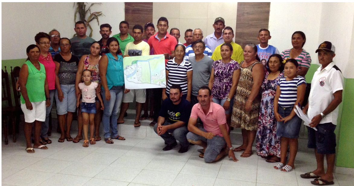
Figura 6: Reunião de conclusão do trabalho etnográfico, no Sindicato dos Trabalhadores Rurais de Rio Tinto. Os participantes apresentam a cartografia social que elaboraram. Fonte: Foto do autor, 3 de outubro de 2015.

Estamos na terra da União, então sabemos que é nossa. A União é nossa, não é? Se a terra é da União, ninguém vai tirar da gente. Se todos que tiver trabalhando com a gente, tiver um pensamento só, tenho certeza que dá certo (palavras de Dona Luzia).