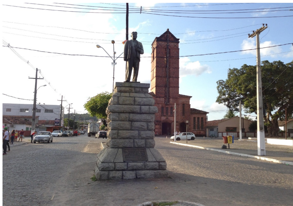
Figura 3: Praça João Pessoa, a praça central de Rio Tinto, com estátua de Frederico Lundgren e a Igreja Matriz de Santa Rita de Cássia, que reproduz o estilo arquitetônico da fábrica da CTRT.

p. 77), o que faz com que a CTRT ainda tenha um peso econômico, político e simbólico significativo no município.