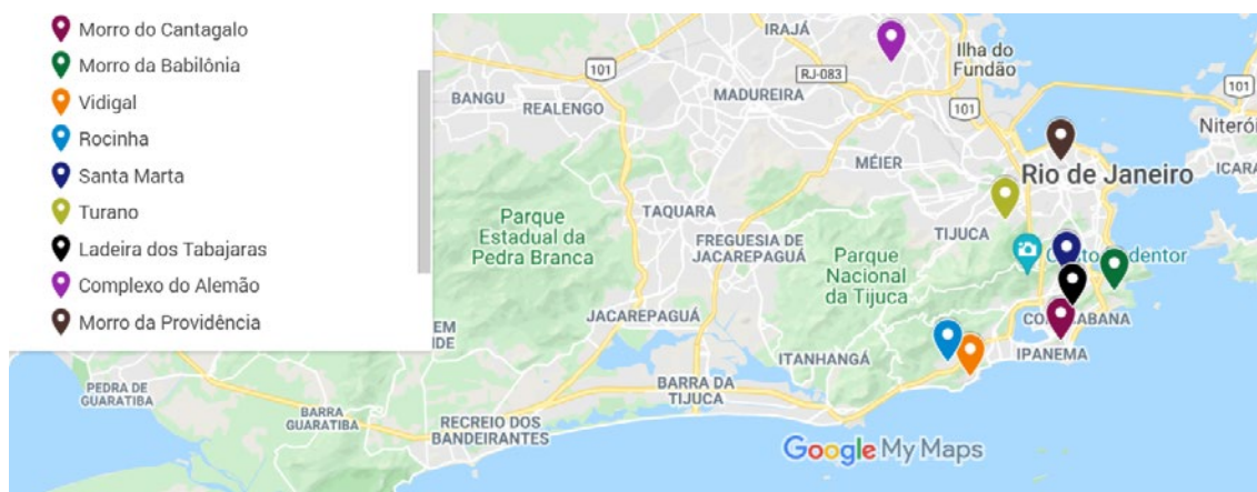
Figura 1 – Mapa das favelas turísticas pesquisadas

Assim, a etnografia multissituada aliada aos métodos móveis me ajudou a cobrir diferentes cenários do turismo em favelas, que se desdobram em práticas significativas que permitem a percepção e a compreensão das conexões entre os agentes locais, apresentando as ligações multissituadas do turismo em favelas.