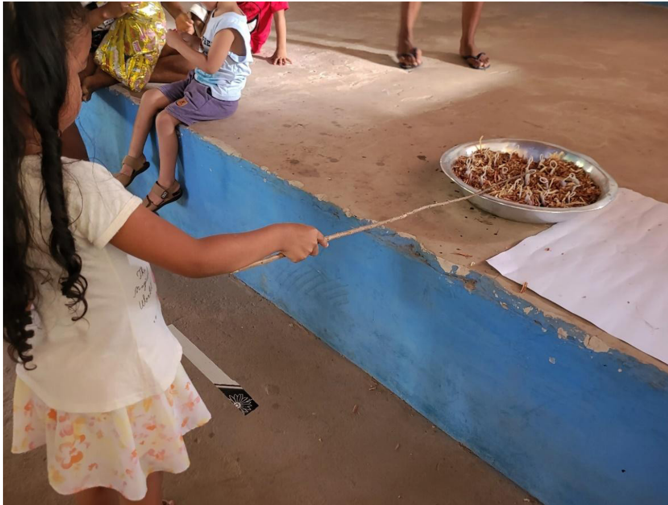
Fotografia 8 – Criança brincando na pescaria. Observa-se a adaptação dos instrumentos usados com materiais locais como bacia, serragem e graveto.