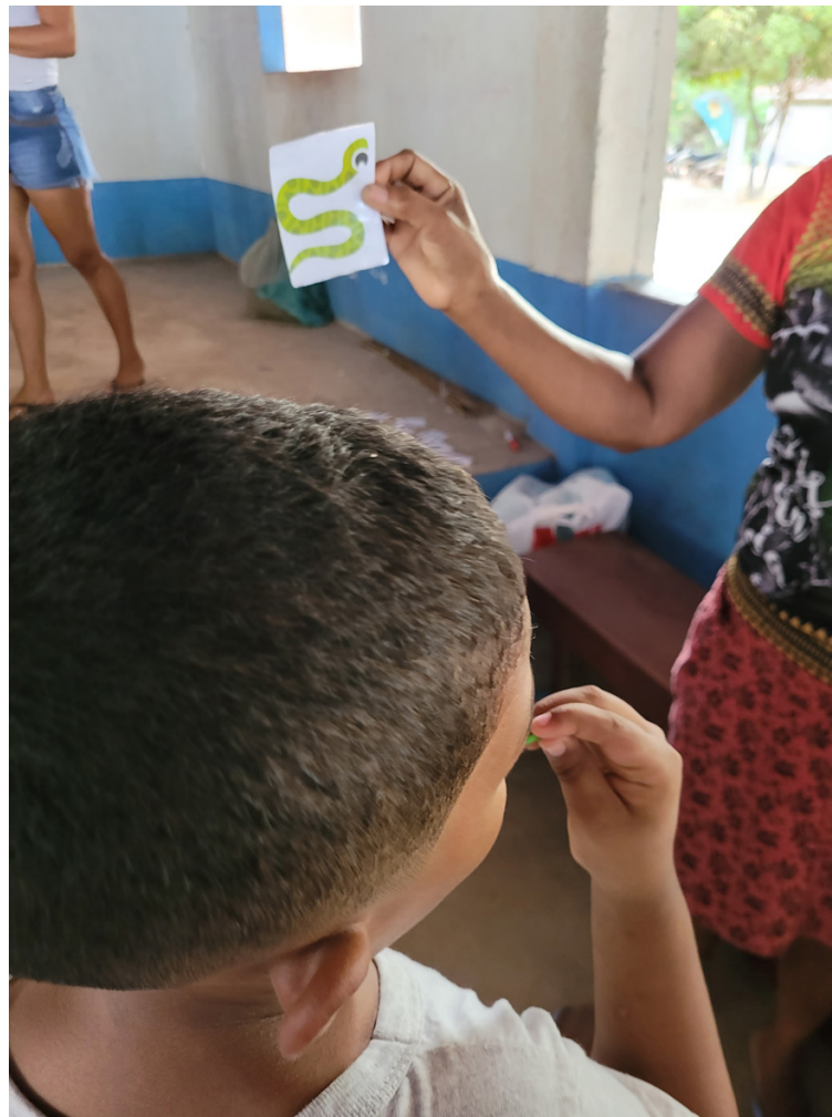
Fotografia 2 – Agente comunitária de saúde contando histórias a partir dos artefatos construídos em conjunto com a universidade.