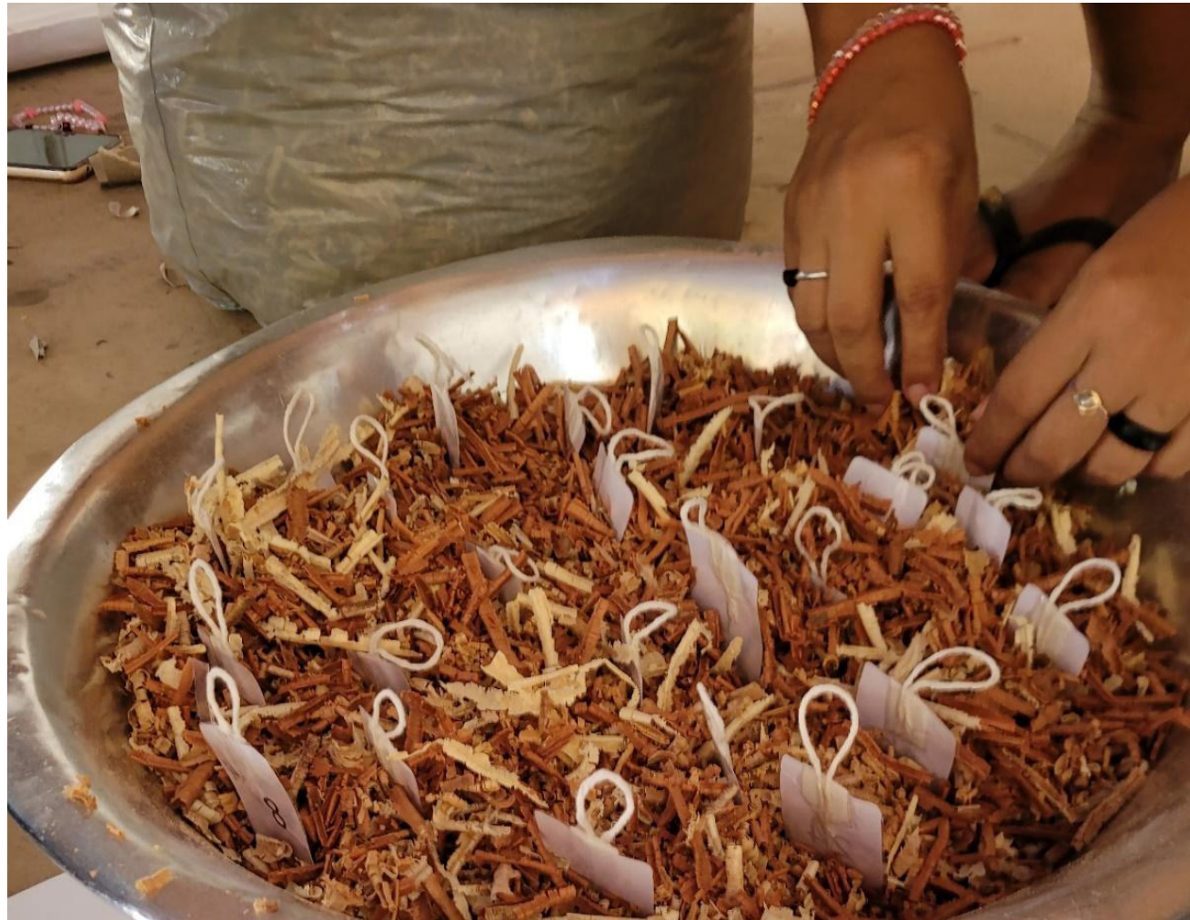
Fotografia 5 – Bacia adaptada com serragem para ser usada como pescaria. Na imagem é possível ver artefatos numerados que subsidiam o processo de brincar. Foto: Autor, 2023