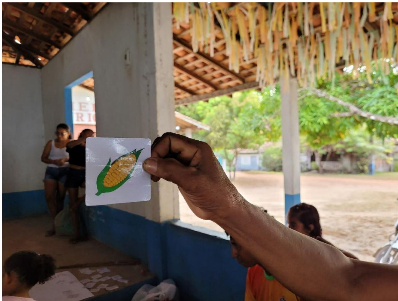
Fotografia 3 – Representação de alimentos usados na comunidade nos artefatos da tecnologia para o “brincar”. Foto: Autor, 2023