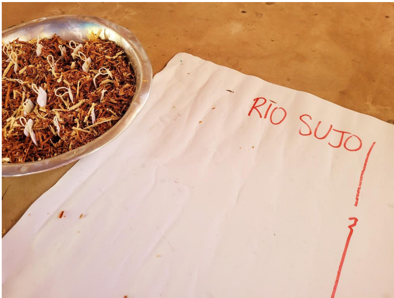
Fotografia 7 – Registro do artefato.