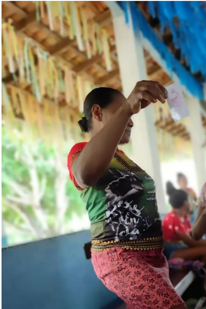
Fotografia 4 – Agente comunitária de saúde contando histórias a partir do artefato identificado pelas crianças.