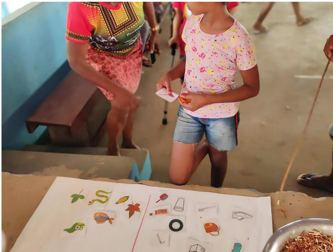
Fotografia 9 – Registro da orientação da agente comunitária de saúde à criança.