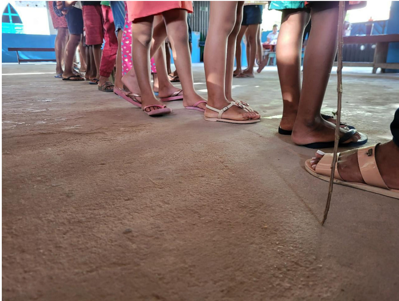
Fotografia 1 – Esperando a vez na brincadeira. Crianças da comunidade em fila administrada pela agente comunitária de saúde, para participar da brincadeira da “pescaria”.