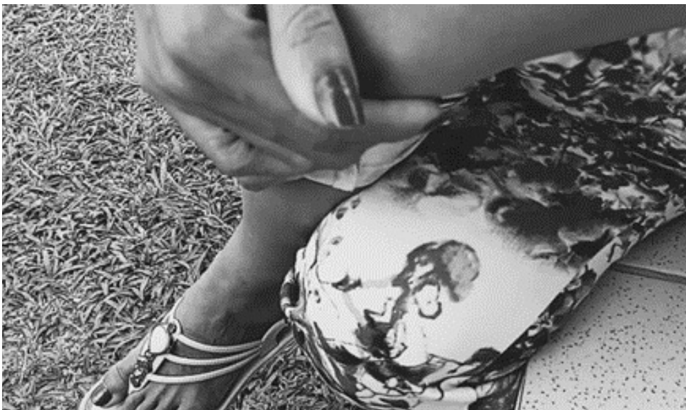
Figura 6 - “Conversas de pé de chinelo”