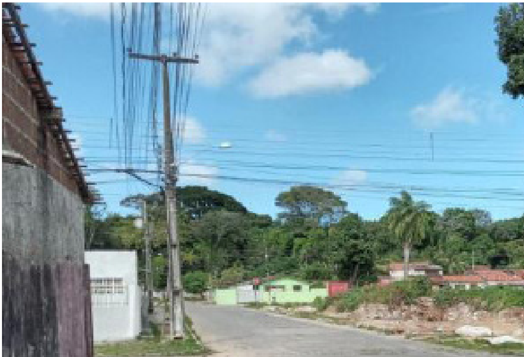
Figura 1 - Rua que faz fronteira com o CAPS AD III

Destacamos que, ao longo da pesquisa, acompanhamos vários grupos de pessoas que frequentavam este serviço em diversas caminhadas, tanto no bairro quanto em outros espaços da cidade. Foram atividades do cotidiano, que possibilitaram outras formas de ocupação dos espaços, as quais fomos convidados, enquanto pesquisadores, a acompanhar. Tais travessias serão problematizadas a partir de algumas experiências relatadas a seguir.