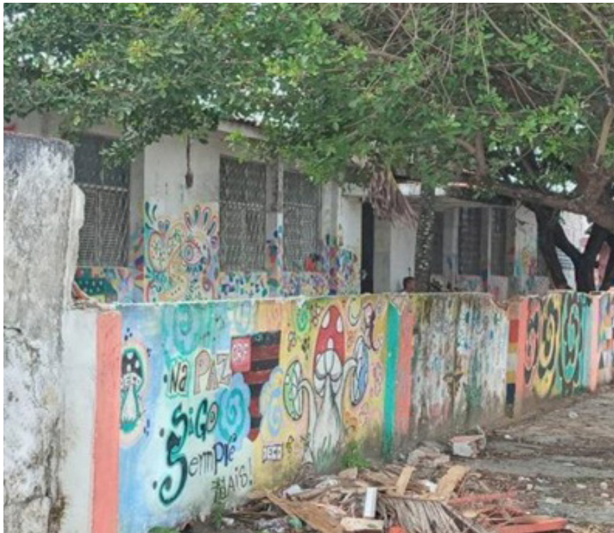
Figura 5 - Escombros do CAPS AD III

fechamento deste serviço. Tal situação deveu-se à precariedade estrutural do prédio onde o CAPS funcionava, juntamente com a falta de manutenção da infraestrutura do imóvel. Destacamos que essa precariedade no serviço já era escutada nas narrativas dos participantes da pesquisa e, além disso, percebemos, no decorrer de nossa frequência em campo, que se tratava de estruturas deficitárias, com baixas possibilidades de oferecer um cuidado terapêutico. As estruturas deficitárias não resistiram a um temporal na cidade. O CAPS ruiu.