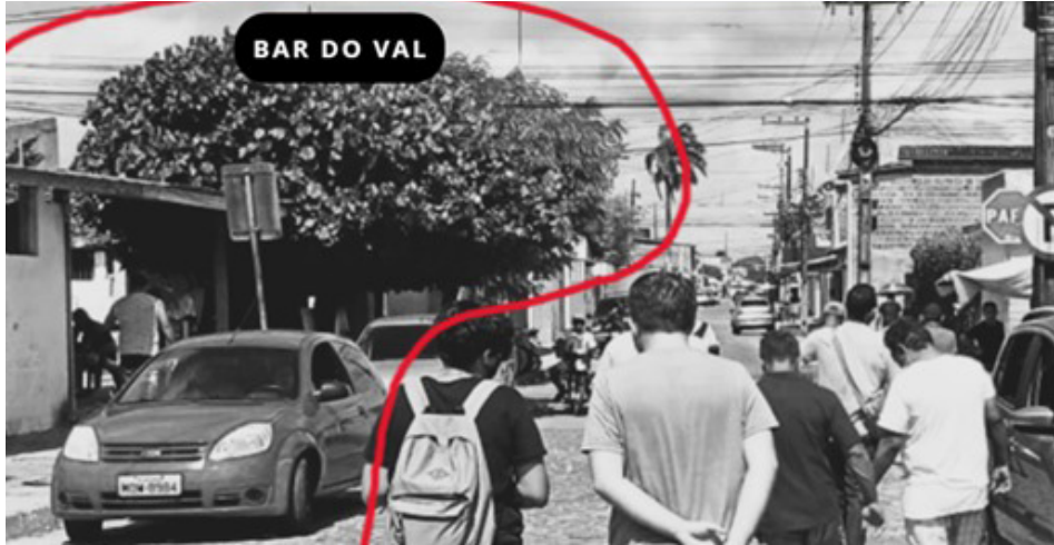
Figura 7 - Rua do Bar do Val