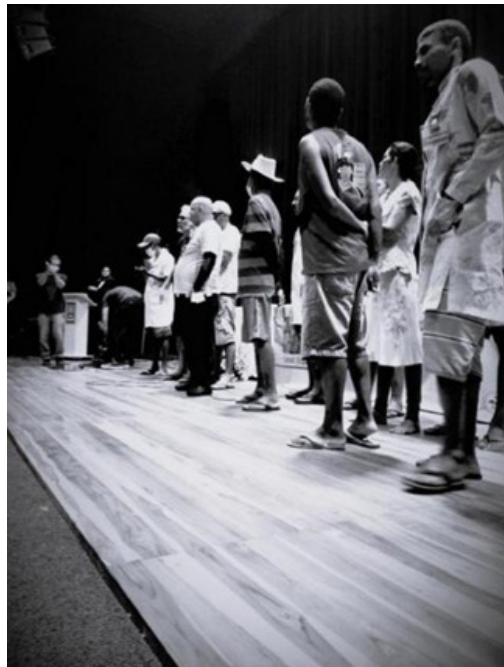
Figura 4 - IV Conferência Municipal de Saúde Mental: encerramento e leitura da carta-protesto

popular de saúde. Desde a cena-intervenção feita pelos frequentadores do CAPS AD III, que destilou, em alto som de batuques, os versos dos sofrimentos existentes na atualidade e das formas cristalizadas e muitas vezes violentas de assistência, até a interrupção da discussão dos trabalhos do eixo, juntamente com a ideia coletiva de se fazer escutar por meio de uma carta lida na plenária final, nos autorizamos a pensar esses exemplos a partir de outro movimento, em outro espaço construído e difuso à revelia dos protocolos estatais instituídos naquela conferência. Algo insistiu em acontecer e estávamos diante de algumas “máquinas de guerra”.