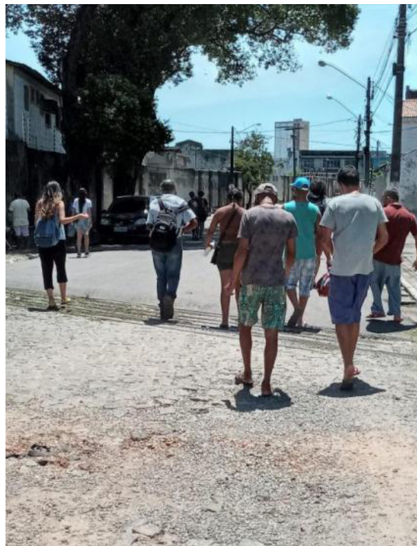
Figura 2 - Travessias andarilhas nos territórios