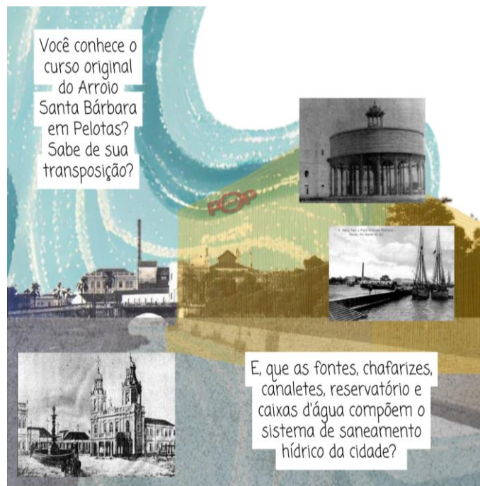
Figura 14 - Pelotas pelas águas