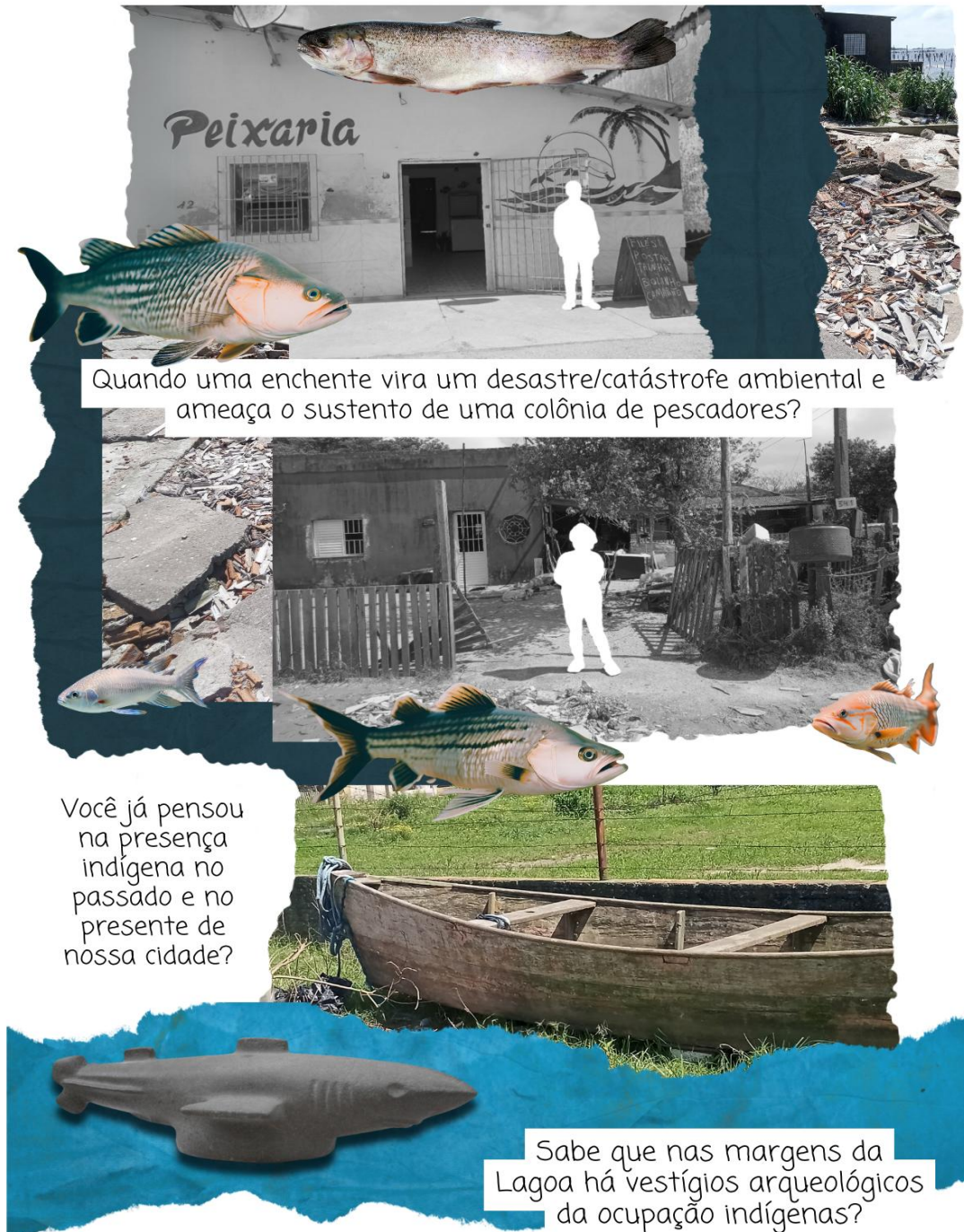
Figura 3 - Peixarias