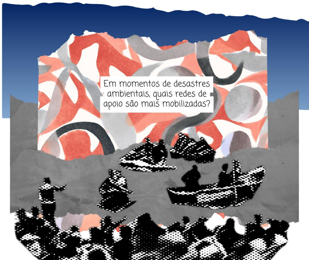
Figura 12 - Redes de apoio

Fonte: colagem de Gabriela Siqueira, 2024.