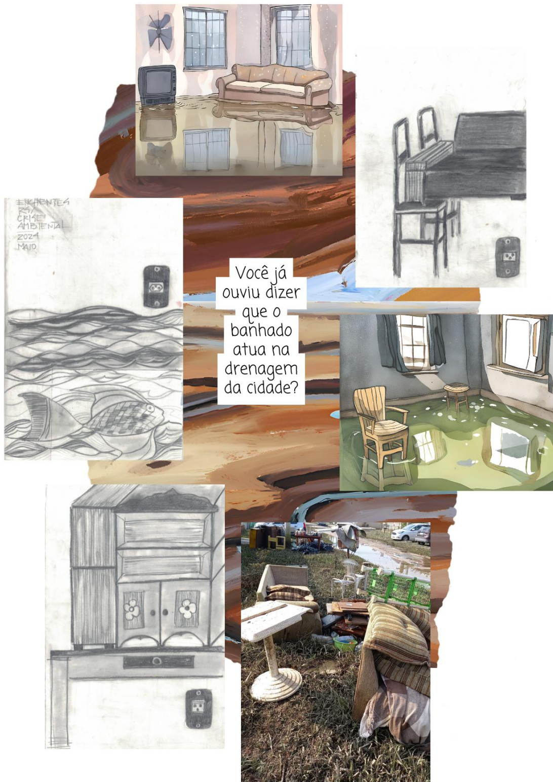
Figura 6 - Banhado

Fonte: colagem de Gabriela Siqueira. Desenhos de Flávia Rieth. Foto de Jaqueline. 2024.