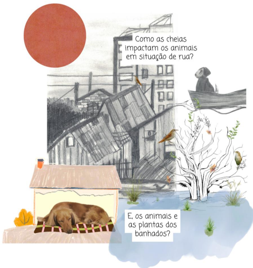
Figura 11 - Laços multiespécie

Fonte: colagens com desenhos de Flávia Rieth e Gabriela Siqueira.