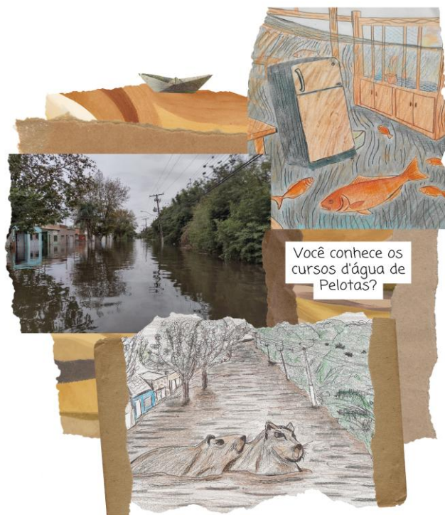
Figura 5 - Cursos d'água de Pelotas

Fonte: desenhos e colagem de Gabriela Siqueira. Foto de Giovanni Nachtigall Mauricio. 2024.