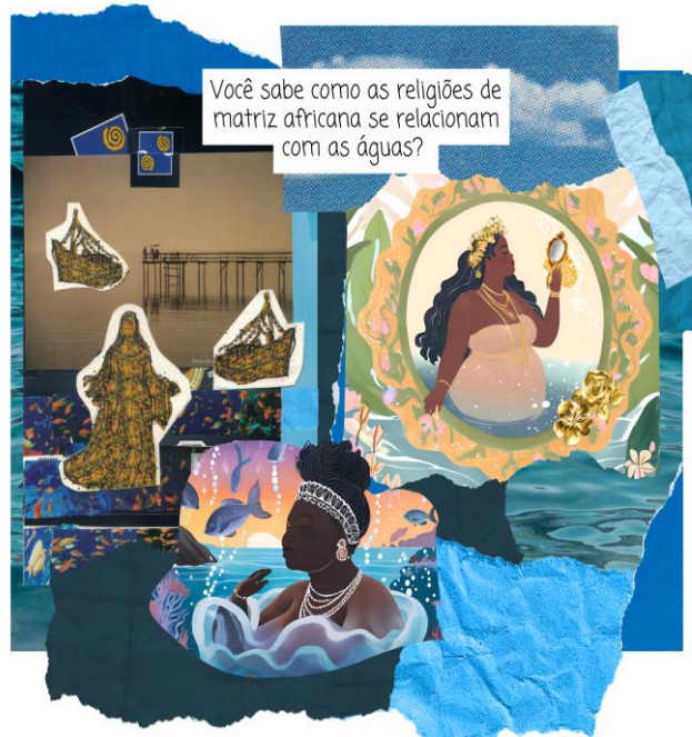
Figura 8 - Religiões de matriz africana