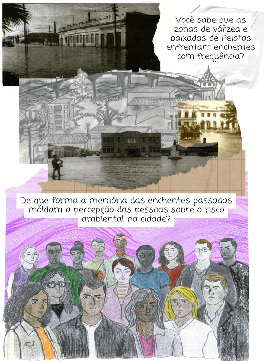
Figura 15 - Memórias da “enchente”

Fonte: colagem de Gabriela Siqueira, 2024.