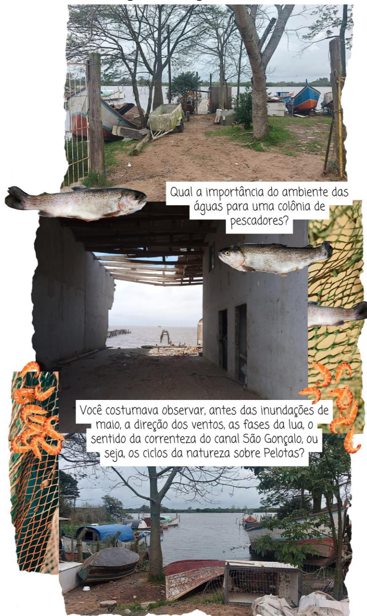
Figura 2 - “Água cheia”