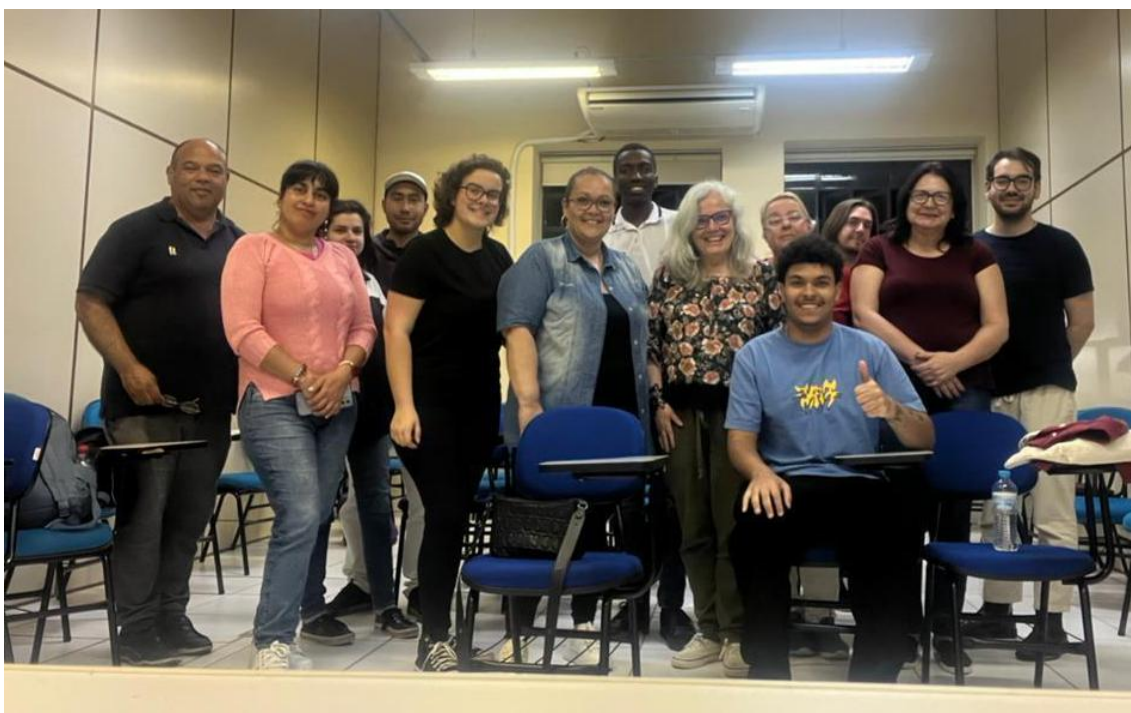
Figura 16 - Turma de Sociedade e Extensão e Antropologia I, UFPel/2024.