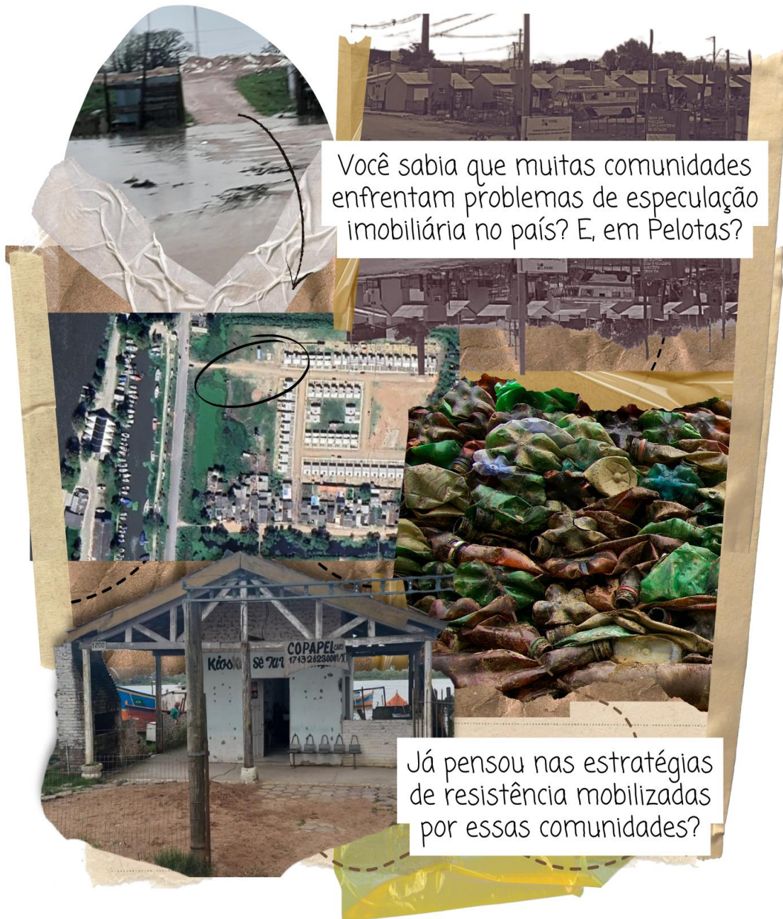
Figura 10 - Resistência

progressiva, o que se alastra cada vez mais para o restante das casas a partir do centro.