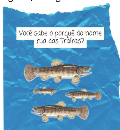
Figura 4 - Antiga Rua das Traíras

Fonte: colagem de Gabriela Siqueira, 2024.