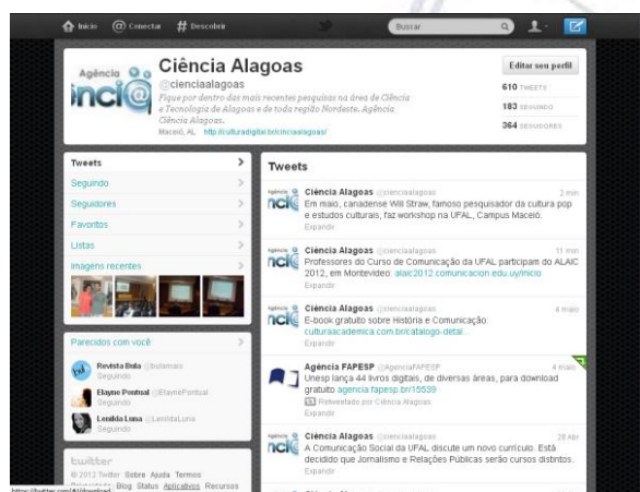
Imagem 4: Endereço @cienciaalagoas