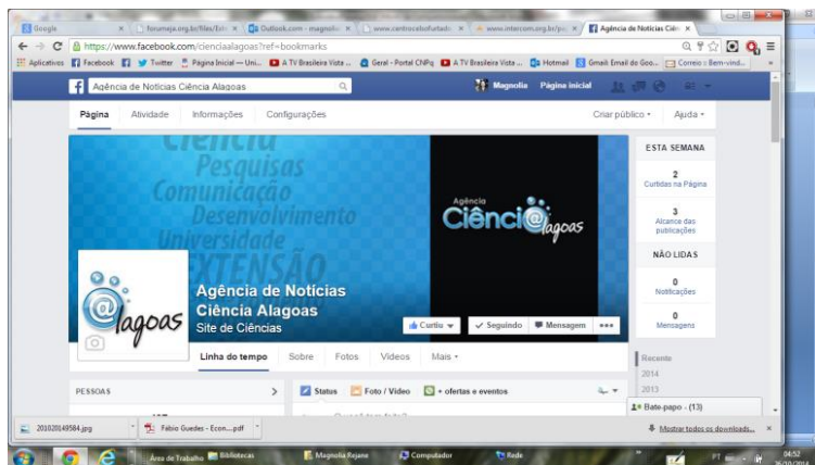
Imagem 3: Ciênci@lagoas no FB