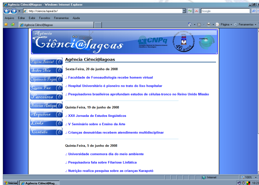
Imagem 1: Agência Ciênci@lagoas

atendendo às demandas do Departamento de Difusão e Popularização da Ciência e Tecnologia, da Secretaria de Ciência e Tecnologia para Inclusão Social do CNPq. Esse primeiro projeto era intitulado Ciênci@lagoas: C&T no Rádio Alagoano via Internet . Ele propunha a criação de um site de notícias, onde breves notas em áudio seriam disponibilizadas gratuitamente, em streaming e podcast, para a utilização livre pelas emissoras de rádio da capital e do interior alagoano. O financiamento viabilizou a montagem de um estúdio de gravação. Como não houve disponibilidade no provedor da UFAL, hospedamos o site no provedor da Fundação de Amparo a Pesquisa do Estado de Alagoas/FAPEAL. Após dois anos de atividades sistemáticas, a falta de verbas para fazer a manutenção dos equipamentos determinou o fim do projeto nesse formato e o início de uma nova proposta de trabalho.