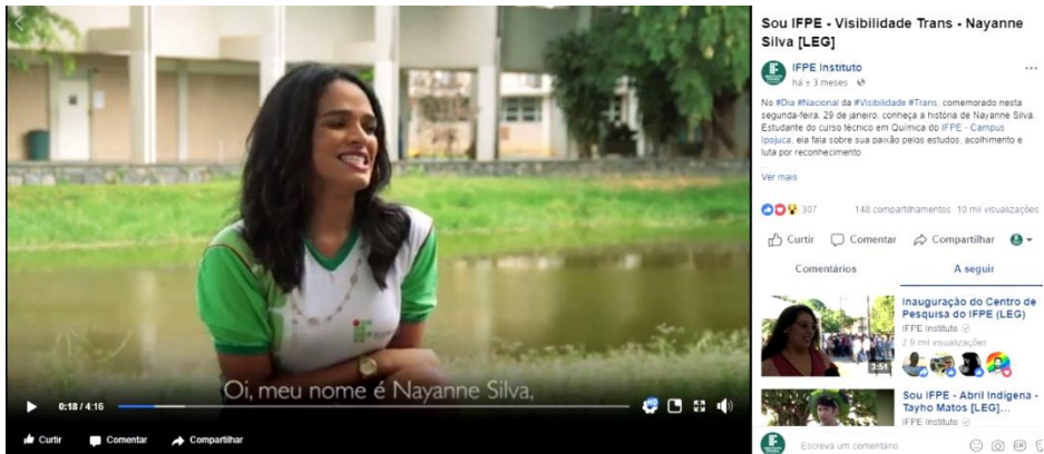
Figura 6 – Exemplo de postagem contemplando a Comunicação Pública