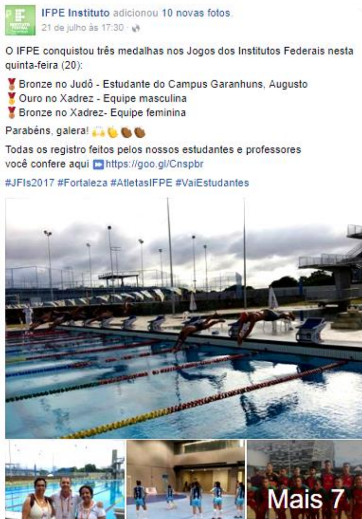
Figuras 3 - Publicações realizadas com material enviado pelos usuários