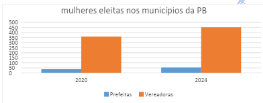
Gráfico 2 - Representação dos números de mulheres eleitas nos municípios da PB – eleições 2020 e 2024.

Apesar de os números ainda apresentarem uma desigualdade na participação feminina e, comparando com as eleições municipais de 2020, os resultados das urnas trouxeram um avanço no número de mulheres eleitas no estado. Dos 223 municípios, 54 prefeituras serão administradas por mulheres, um aumento de 45% em relação à última eleição que deu a vitória a 37 candidaturas femininas ( gráfico 2 ). Nas Câmaras municipais, houve também um aumento de 25% (Fechine, 2024), e das 2.565 cadeiras de vereadores espalhadas na Paraíba, 452 serão ocupadas por mulheres.