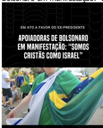
Figura 1 - Apoiadoras de Bolsonaro em manifestação: “Somos cristãs como Israel”.