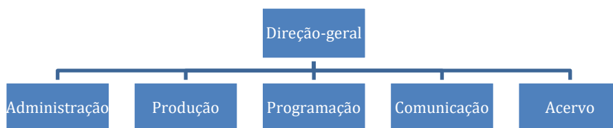
Figura 2: Organograma sinóptico do fundo Circo Voador.