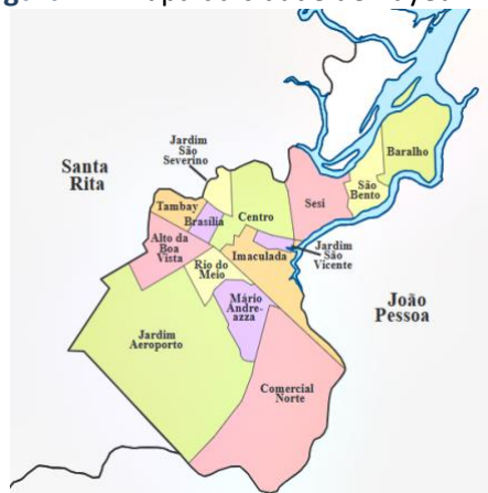
Figura 1 – Mapa da cidade de Bayeux – PB

Segundo Silva (2014, p.16), a colonização do município de Bayeux está ligada às histórias de João Pessoa e Santa Rita. E, em 1585, foi fundada a cidade de Filipeia de Nossa Senhora das Neves (atualmente João Pessoa) e anos depois foi iniciado o povoado de Santa Rita, cidade vizinha a Bayeux – PB.