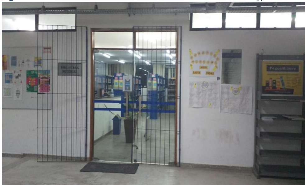
Figura 2 – Hall de entrada da Biblioteca Setorial Berilo Borba do CCSA//UFPB

A Berilo Borba integra o sistema de bibliotecas da UFPB, corroborando com o pilar da instituição de ensino, pesquisa e extensão, busca acompanhar o desenvolvimento tecnológico, informacional e social da instituição e de seus usuários (UFPB, 2017). No CCSA, a biblioteca setorial atende aos cursos: Arquivologia, Biblioteconomia, Administração, Ciências Atuariais, Ciências Contábeis, Gestão Pública, Ciências de Dados para Negócios e Relações Internacionais.