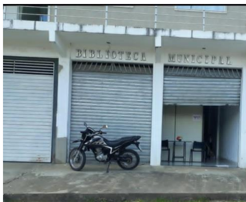
Figura 3 – Fachada da Biblioteca Pública Municipal Almir Clementino Muniz