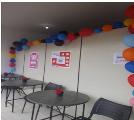
Figura 6 – Preparativos para receber os estudantes na volta às aulas em 2023

no respeito à diversidade, na inclusão social e na preservação da memória local. Nas figuras 6 e 7 apresentam a receptividade da biblioteca aos seus usuários: