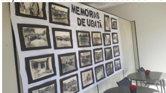
Figura 8 – Exposição de fotos de Ubatã na ocasião do aniversário da cidade