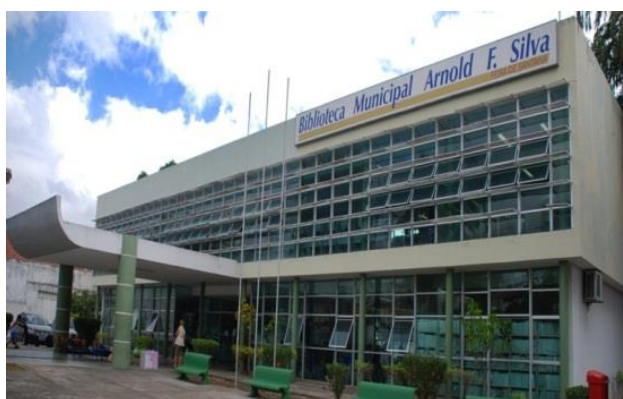
Figura 2 - Biblioteca Municipal de Feira de Santana – Atualmente

A Biblioteca Municipal Arnold Ferreira da Silva foi reformada em 2019. Embora relevante, sua história não será aprofundada neste estudo.