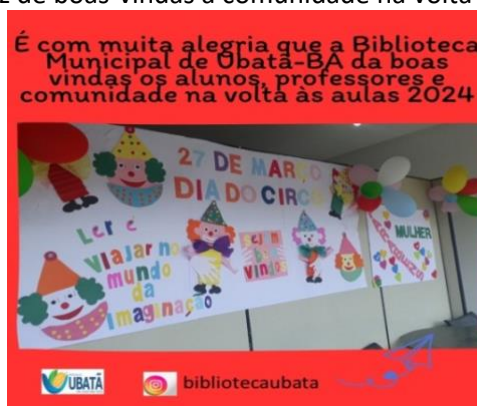
Figura 7 – Cartaz de boas-vindas a comunidade na volta as aulas em 2024