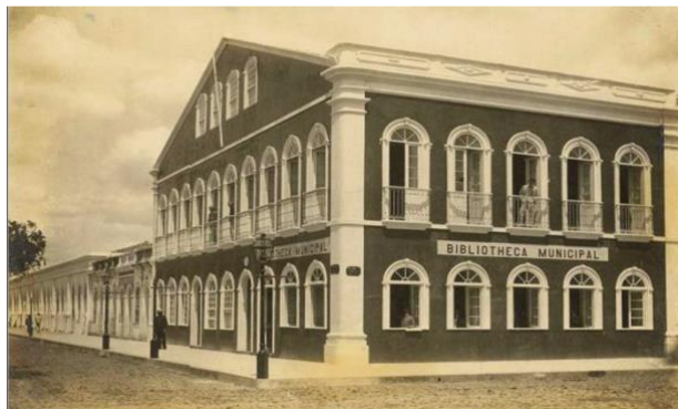
Figura 1 - Biblioteca Municipal de Feira de Santana – Século XIX

Praça João Pedreira, sendo transferida posteriormente para a Rua Geminiano Costa, passando a se chamar Biblioteca Municipal Arnold Ferreira da Silva 5 , conforme Resolução da Câmara Municipal de 4 de dezembro de 1961. Nas Figuras 1 e 2 pode-se observar a transformação da referida biblioteca ao longo do tempo.