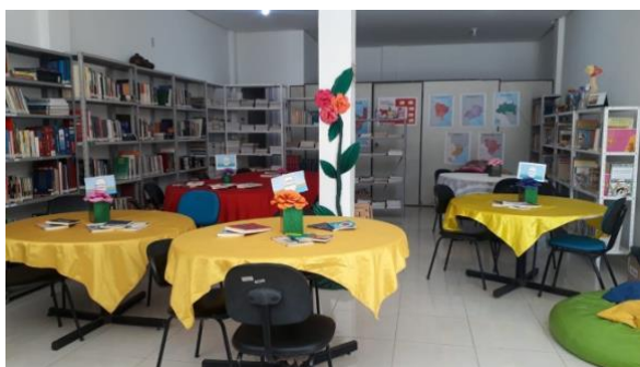
Figuras 9 e 10 – Preparativos da Atividade Encontro com o escritor

As atividades rotineiras da biblioteca incluem serviços de empréstimo, apoio à pesquisa e o cantinho de leitura infantojuvenil. Entre os projetos desenvolvidos, destacam-se: “Literatura na Biblioteca”, “Mural Temático”, “Encontro com o Escritor”, “Exposição Temática”, “Mesa Cardápio”, “Espaço para Conferências”, “Produção de Videoaulas e Lives”, “Momento Cultural”, “Visitas Dirigidas e ações em Datas Comemorativas”. Nas Figuras 9 e 10 pode ser visto um registro dos preparativos da atividade “Encontro com o Escritor”.