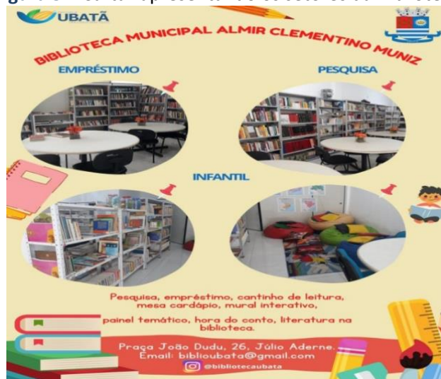
Figura 5 – Cartaz apresentando os setores da Biblioteca

O espaço é dividido em três setores: pesquisa, empréstimo e infantojuvenil, e conta com um acervo de mais de 5 mil itens, entre os quais se destacam: livros de diversas literaturas, materiais para pesquisa, cantinho de leitura infantojuvenil, além de periódicos, atlas, dicionários, enciclopédias, mapas e outros materiais recebidos do Ministério da Cultura (MinC). A Figura 5 apresenta os setores da referida biblioteca.