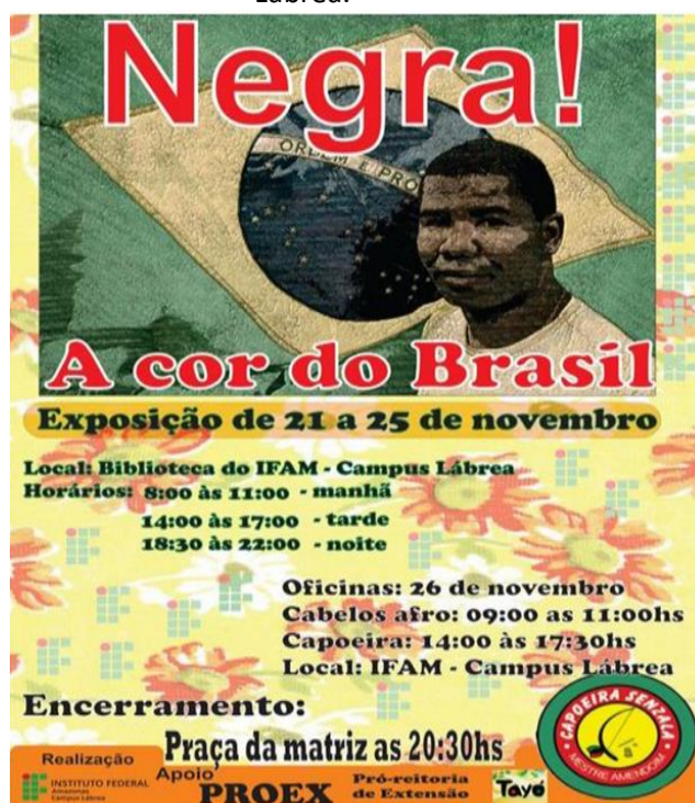
Figura 1 - Cartaz do Projeto Negra! A cor do Brasil, do Instituto Federal do Amazonas - Campus Lábrea .

A quarta e a quinta categoria foram formadas pelas práticas educativas voltadas para a valorização da cultura negra e a valorização dos povos indígenas, onde os relatos mostram a preocupação com a valorização dos povos marginalizados no país. Na Figura 1 apresentamos cartaz de evento realizado na biblioteca do Instituto Federal do Amazonas (IFAM) Campus Lábrea .