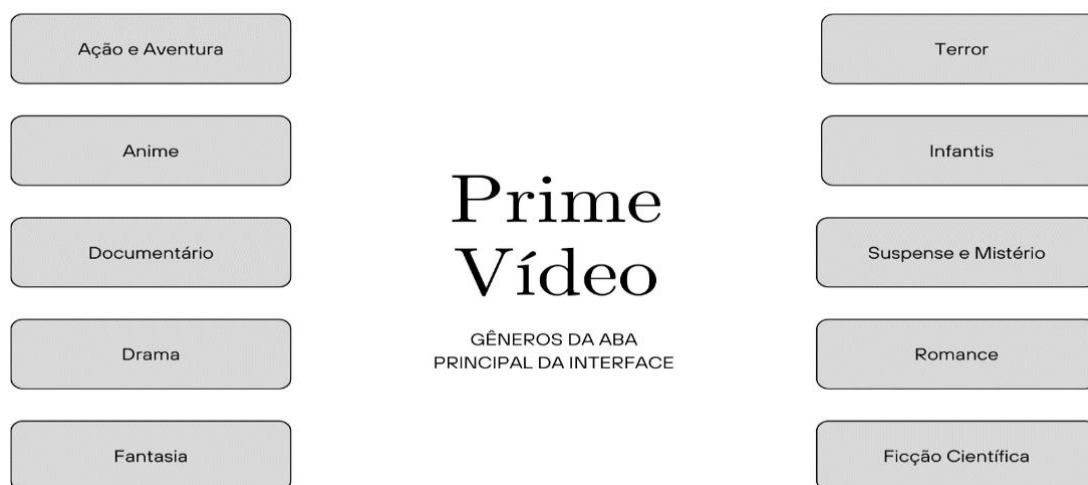
Figura 1 - Gêneros Interface Principal Prime Vídeo

No entanto, a categorização de gêneros apresenta uma fragmentação que compromete a navegabilidade. A seção “Categorias” onde são apresentados os gêneros existentes de séries e filmes é diferente para cada tela em que abrimos, mas no geral ela inclui uma divisão entre gêneros tradicionais e coleções temáticas. Embora essa abordagem seja válida do ponto de vista editorial e de curadoria, os gêneros não aparecem unificados em uma única tela, exigindo que o usuário explore diferentes caminhos para encontrar conteúdos de um mesmo tipo. Na aba principal da interface, ao clicarmos na aba de pesquisa aparecem poucos gêneros a serem selecionados (Figura 1)