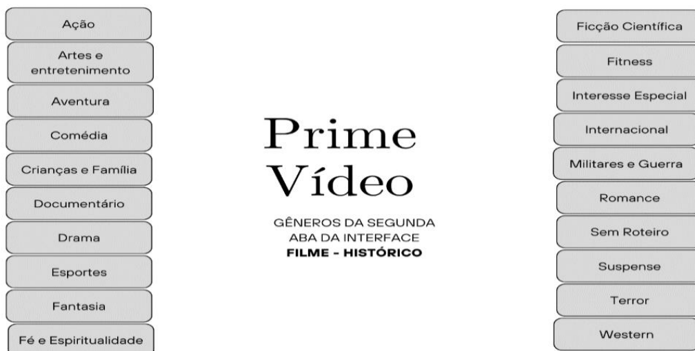
Figura 2 - Gêneros Interface Secundária Prime Vídeo Filme

Para a pesquisa, foi selecionado um filme e uma série transmídia de cada plataforma para fazer a comparação entre os diferentes menus de gêneros existentes em cada canal de streaming. Na Prime Vídeo, é possível identificar que ao selecionarmos o filme “O Morro dos Ventos Uivantes”, a plataforma mostra outras categorias e gêneros diferentes das já apresentadas no menu principal (Figura 2).