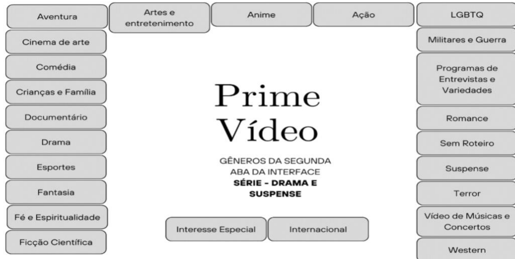
Figura 3 - Gêneros Interface Secundária Prime Vídeo Série