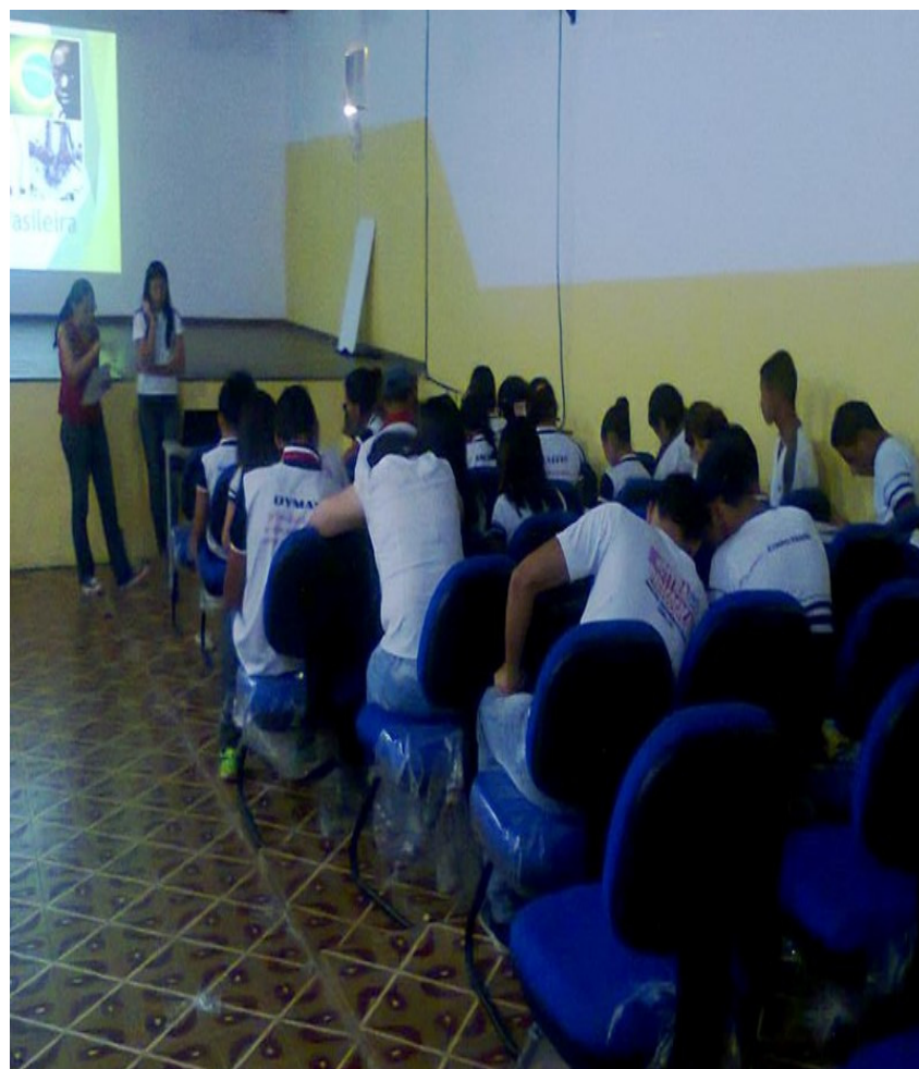
Aplicação do questionário – Turma 3º B