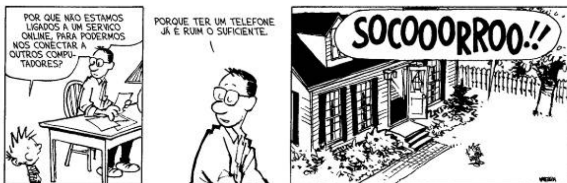
Figura 1: Calvin & Haroldo, de Bill Watterson, é um exemplo de tirinha

A tirinha é uma excelente forma de expressão no jornal e na revista. A mídia impressa precisou se diversificar e atender a diversos públicos, dando a possibilidade de o autor colocar suas vivências, experiências e problemas da vida cotidiana de forma divertida e provocativa, em uma realidade metaforizada, como no exemplo da tirinha abaixo, com os personagens Calvin e Haroldo, produzida por Bill Watterson: