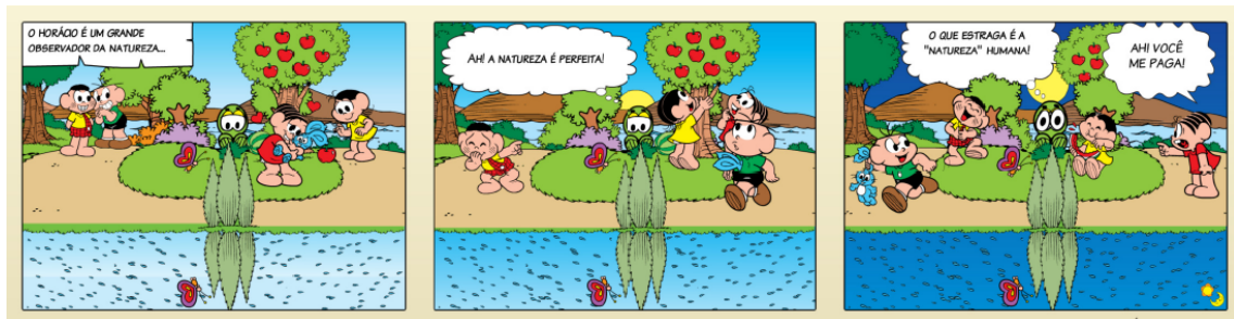
Figura 3: Tirinha do site Máquina de Quadrinhos, do usuário Sol & Lua

No Brasil, destaca-se o site da Máquina de Quadrinhos 12 , criado por Maurício de Sousa durante a comemoração de 50 anos da Turma da Mônica em 2009. Na página você pode criar histórias da Turma da Mônica e as melhores são publicadas em revistas e gibis.