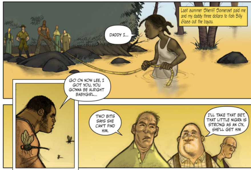
Figura 4: Bayou, de Jeremy Love, um dos quadrinhos publicados no site Zuda Comics e também um dos primeiros vencedores do concurso