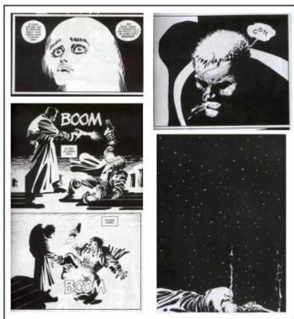
Figura 11: Momentos da história com impacto visual nos detalhes.

Em O Assassino Amarelo , Frank Miller atenta para essa descrição detalhista (fig. 11), a fim de que a carga emocional do conto transpasse a normalidade da violência disposta no cotidiano do leitor. São olhos estupefatos quando o medo toma o personagem; é um único tiro que separa o corpo da mão que segura um revólver; é o boom nos testículos de um estuprador ensanguentado; é a tosse que jorra sangue após vários disparos à queima roupa; é, por fim, o corpo ao chão de um herói suicida: