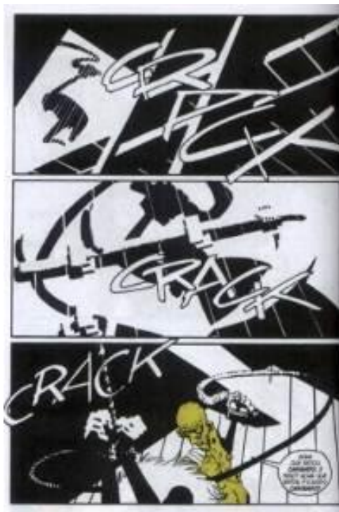
Figura 17: Onomatopéias de chicotadas.