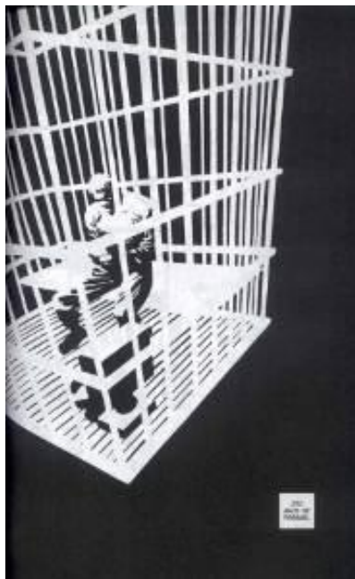
Figura 7: Representação de angústia do personagem.