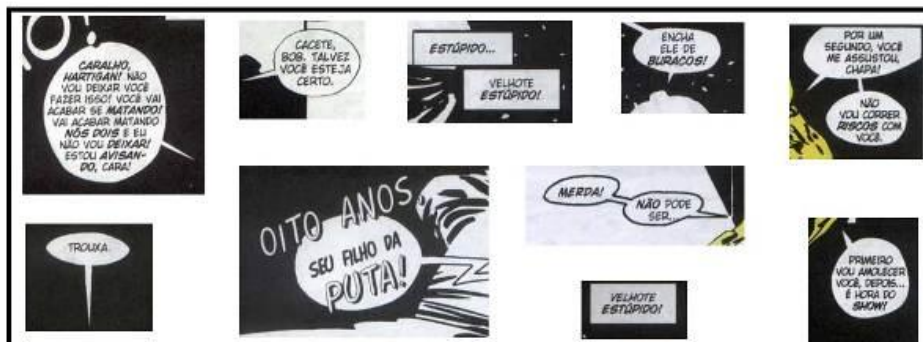
Figura 12: Gírias e palavrões usados na obra.

insatisfação perante atitudes corruptivas e eleva o caráter heroico que a humanidade almeja, aproximando o leitor da narrativa.