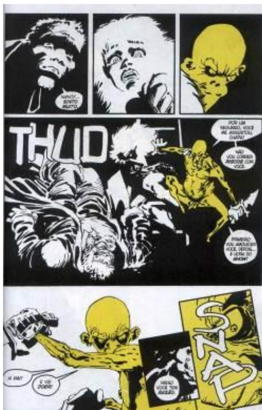
Figura 5: Assassino amarelo.