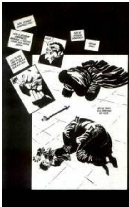
Figura 14: Momento de início de infarto do personagem.