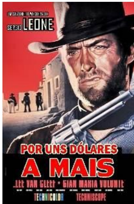
Figura 2: Pôster do filme Por uns Dólares a Mais .