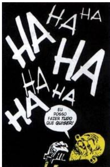
Figura 18: Destaque para as risadas.