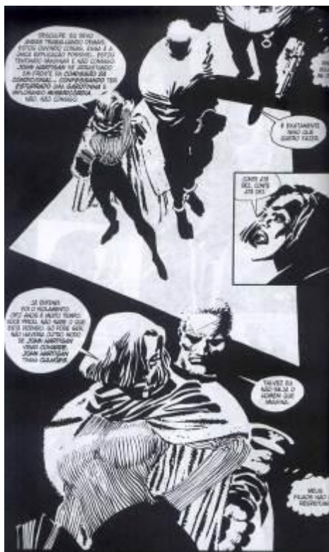
Figura 4: Página interna com desenhos monocromáticos.

Em contrapartida, internamente, toda a história é contada em desenhos monocromáticos (fig. 4), destoando do abuso de cores que os produtos sensacionalistas costumam apresentar, sendo uma maneira de amenizar a espetacularização das imagens que mostram corpos esfaqueados ou cobertos por sangue.