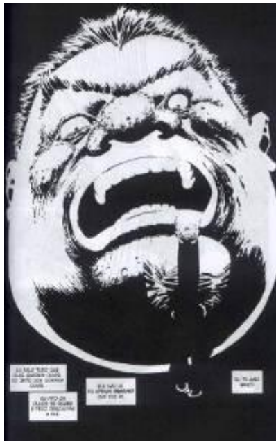
Figura 9: Reforça na fúria do personagem.

Para isso, é preciso que os narradores apelem para o detalhe, por mais violenta que seja a cena, sem a preocupação de poupar o leitor do medo, da insegurança, do terror.