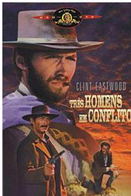
Figura 3: Pôster do filme Três Homens em Conflito .

Em relação a Sin City: O Assassino Amarelo , a capa merece destaque como complemento ao enredo sensacionalista, apresentando um conjunto de tons expressivos como forma de fixar a atenção do público e representar a realidade de forma mais