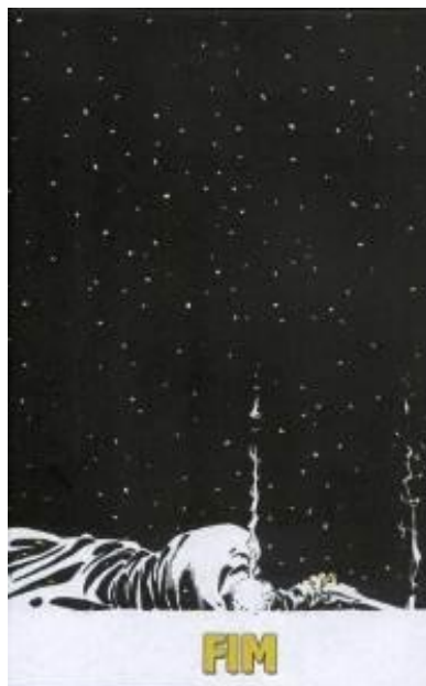
Figura 10: Acentuação do instante de morte do personagem.