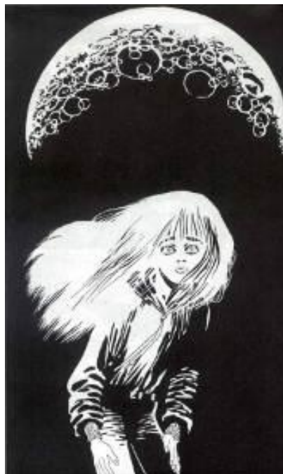
Figura 8: Expressão de medo da personagem.

Para a sociedade pós-moderna, repleta de conflitos, crimes bárbaros já não espantam tanto quanto antes, por estarem corriqueiramente presentes em nosso meio.