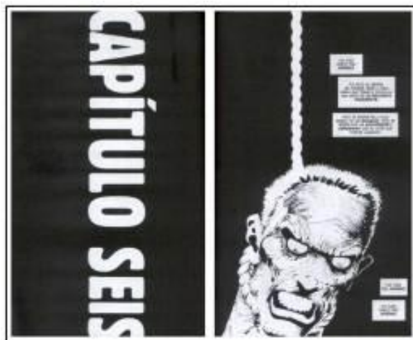
Figura 16: Recurso de antecipação da posição da corda.

Um recurso linguístico típico das histórias em quadrinhos são as onomatopeias, que substituem o som nessa plataforma impressa. Em Sin City , elas são bem utilizadas para criar tensão, suspense e angústia no leitor, que muitas vezes se depara apenas com o som, sem ver a causa dele de fato (fig. 17). Em alguns casos, a onomatopeia é usada para exprimir o poder que um personagem tem sobre o outro, em um tom de deboche, como na risada tomando conta do quadro quando o assassino amarelo aprisiona o protagonista (fig. 18).