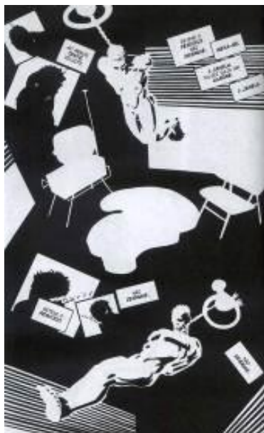
Figura 15: Cena de fuga do personagem de um enforcamento.

O autor ainda brinca com o uso do recurso de antecipação, ao colocar na vertical a indicação de “Capítulo Seis” e, na sequência, como que continuando o título, uma corda que desce até o pescoço de Hartigan (fig. 16).