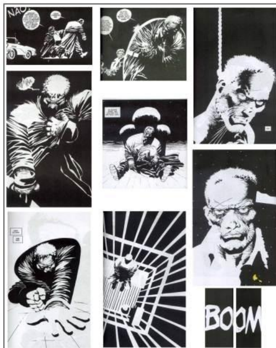
Figura 6: Momentos de superação de Hartigan.

A sociedade, em meio a construções culturais de identidade, de diferenciação entre o certo e o errado, idealiza como o ser correto quem possui qualidades pessoais de força física, caráter e moral e usa tais características para transcender o individual e beneficiar o coletivo. Fantasia o herói e julga como vilão quem obstrui caminhos alheios.