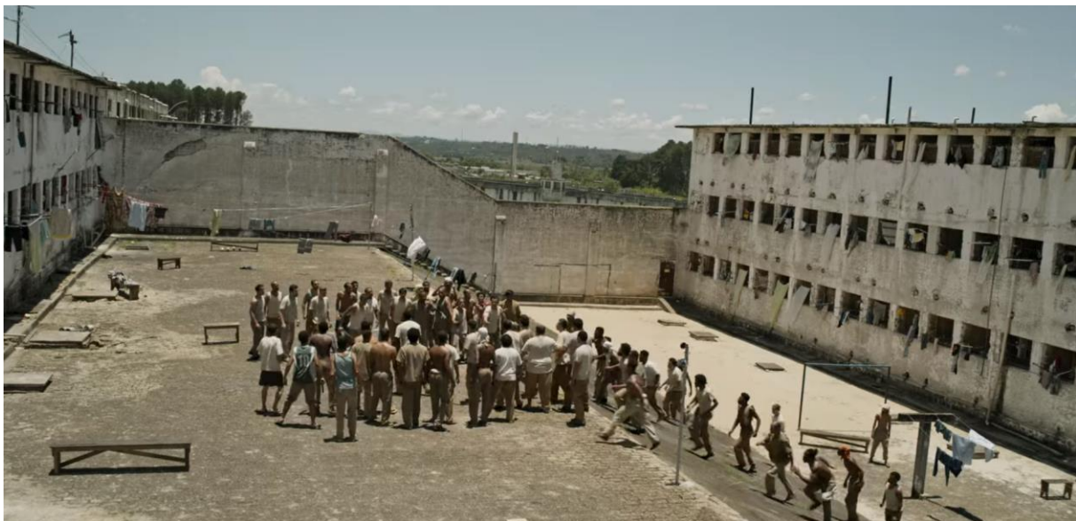
Figura 01: Ala en desuso de una penitenciaría que sirvió de escenario para Irmandade .

En segundo lugar, son obras que apuestan por una auténtica diversidad de escenarios y medios, que contribuyen a su "individuación" (Caldwell, 1995; Araújo, 2015) y apariencia distintiva. Estos decorados y entornos, muy presentes en las elaboradas secuencias de títulos de obras complejas, implican una atención inusual a la puesta en escena, la verosimilitud y la cinematografía. En combinación con la idiosincrasia conceptual de estos programas, sus cualidades estéticas permiten transmitir con fuerza las especificidades del lugar, el tiempo y la estructura ideológica que sustenta el mundo diegético de un drama televisivo. La veracidad es un elemento sorprendente en Irmandade . Citemos como ejemplo uno de los lugares donde se rodó la historia. Un ala en desuso de la Penitenciaría Estatal Central de Piraquara , en la región metropolitana de Curitiba (fig. 01), sirvió de escenario para las escenas que tienen lugar en el interior de la prisión donde nace la banda criminal. La elección de esta estética realista contribuye a intensificar las sensaciones de un recluso una vez dentro de ese universo.