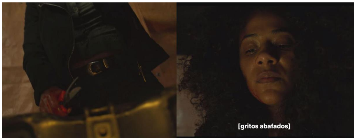
Figura 07: Cristina le corta el dedo al periodista. Fuente: frames del EP07T01 - Netflix Brasil.

Quando se da cuenta de que en el ámbito institucional la justicia falla a los más vulnerables, especialmente a los presos negros y pobres, la idea inicial de justicia de Cristina choca con la realidad a la que se enfrentan los miembros de la facción, las familias y las comunidades involucradas con la Hermandad. La historia expone un mundo paradójico frente a Cristina, en el que surgen preguntas como "¿quién es peor?", "¿quién es más violento?", "¿quién tiene más razón?", "¿qué es la justicia?". La decisión de Cristina de cortar por su cuenta el dedo del periodista favorece este movimiento: al ver cómo un joven, que no pertenecía al