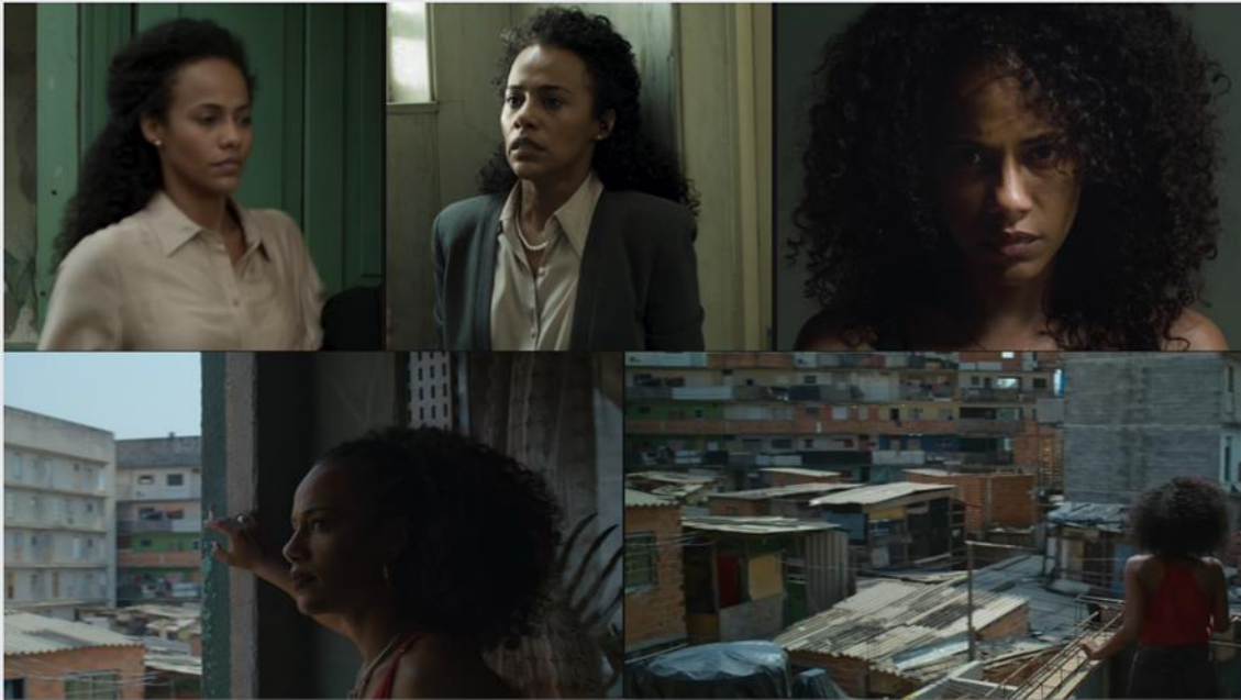
Figura 03: Trayectoria de Cristina en imágenes, de abogada y fiscal a líder de la facción de la Hermandad.

Cristina comienza su trayectoria como asesora del ministerio público, y sus prendas en tonos neutros, su cabello recogido y su mirada asustada evidencian una personalidad tímida y reservada, la de una mujer que vive para su familia (representada en el cuidado de su hermano menor) y para su trabajo. Las experiencias vividas junto a la facción poco a poco la transforman en una mujer valiente y decidida, lo que se refleja en su mirada fija hacia la cámara y su cabello suelto y voluminoso. Finalmente, a esta mujer valiente y decidida se le suman el poder y la inteligencia, representados en sus prendas coloridas y su posición en el cuadro dramático desde lo alto de un balcón, mirando hacia la comunidad que ahora lidera.