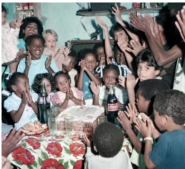
Foto 4: Aniversário da Renatinha. Data: 1988

“Na época ninguém tinha nada, era raro. Mas acho que eles tinham esperança das crianças estudarem, irem pra frente. É igual eu, estudar, ter alguma coisa, ser alguém na vida, é o que a gente quer para os filhos. Essa foto que eu vi com um pai, uma mãe e as crianças, acho que eles queriam isso, gravar ali, “ó vocês pequenos e depois de grandes vocês vão ter uma vida boa”. Porque estar dentro de uma favela, na época aqui das fotos, não era nada, era uma favela que nem rua asfaltada tinha, todo mundo brincava na terra. E hoje está bem diferente lá dentro tem até prédio. Todo mundo construindo três, quatro andares. Então vendo lá atrás e vendo hoje, as pessoas juntavam moedinhas para tirar foto, ninguém tinha dinheiro, pagava a prestação. Todo mês o Afonso [Pimenta] ia lá receber. Hoje é fácil tirar foto, mas antes não era. (...) Na minha época, quem nasceu lá há cinquenta anos, não tinha oportunidade nenhuma de crescer, de estudar, de ser alguém. Chegava era na quarta série e olhe lá, ensino médio ninguém nem pensava. Porque tinha que parar de estudar para ir trabalhar. Não tinha expectativa. Hoje tem cursos lá dentro, que é do mundo lá fora, supergrande, e estão entrando lá dentro, não é um lugar marginalizado.” (Entrevista com Maria das Graças, 2024)