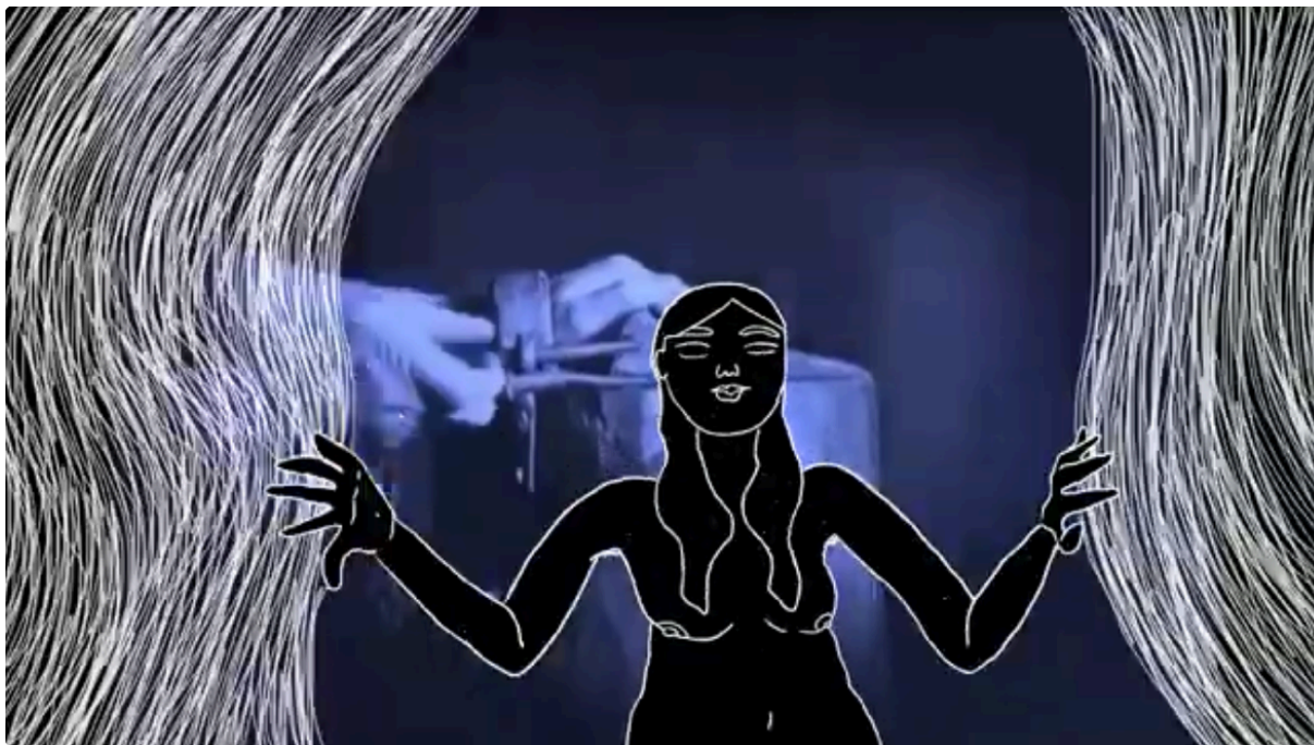
Imagem 3 - Captura de tela do vídeo Faixa a Faixa Romã #06 – Canção da Bruxa 1

As fogueiras de hoje são diferentes, elas ainda queimam nas ruas, nos lares e dentro de nós - pra você, o que é ser bruxa? A minha resposta eu compartilhei no último episódio do Faixa a faixa Romã, sobre A canção da bruxa, que você pode assistir completo aqui no Igtv ou no Youtube (link na bio). Essa semana tem episódio novo. Compartilhe se você curtiu ★ Seu apoio é muito importante! Mais uma #Eumesmaproduções #Animationart #Bruxariamoderna #Animationvideo .