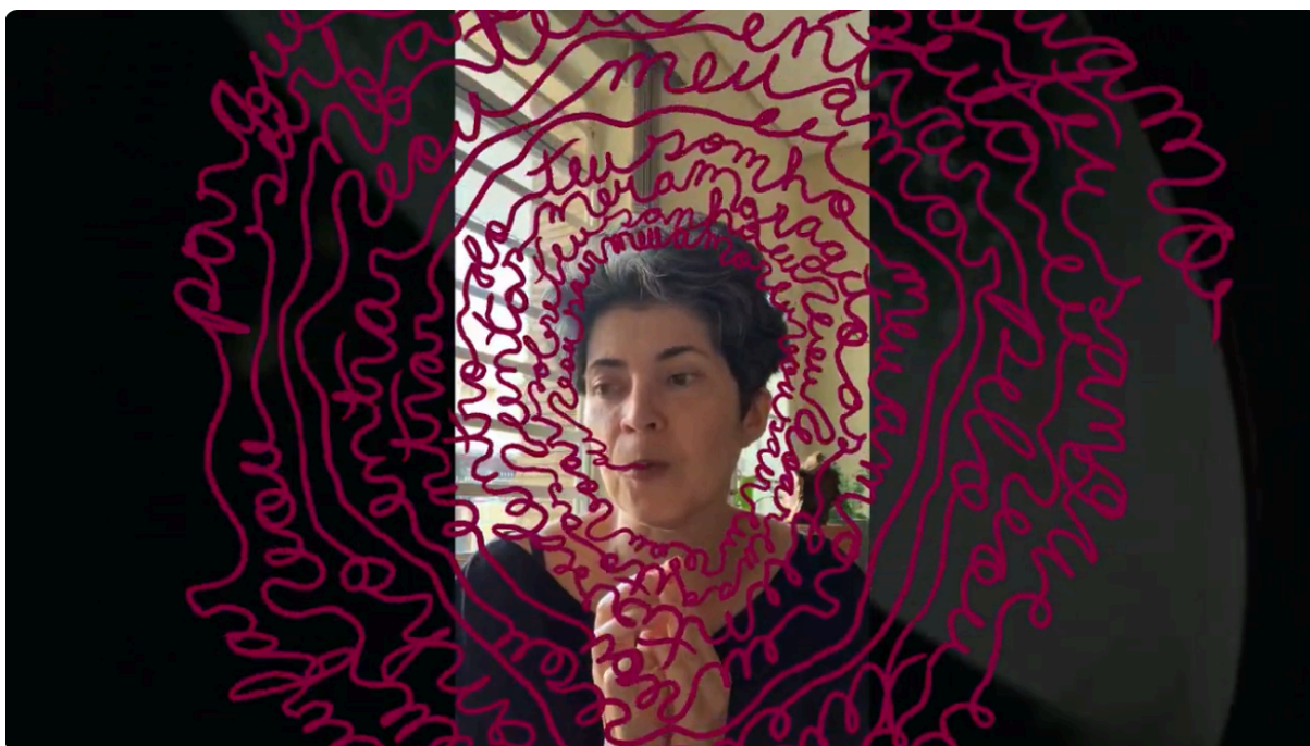
Imagem 4 - Captura de tela do vídeo Faixa a Faixa Romã #06 – Canção da Bruxa 2.