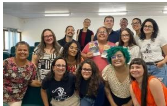
Alunos, professores e palestrantes ao final do evento.

Esse material surge como uma ferramenta que busca não apenas garantir o acesso a serviços públicos, mas também reconhecer a complexidade dos processos de reintegração social, enfrentados por mulheres que, ao deixarem a prisão, se deparam com múltiplas barreiras sociais, econômicas e institucionais. O lançamento da cartilha marcou, assim, um importante passo na consolidação de políticas voltadas à dignidade e ao fortalecimento da cidadania dessas mulheres.