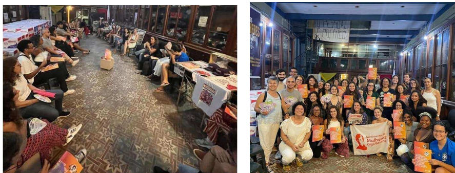
Fotos da roda de conversa de lançamento da Cartilha “A Casa Almerinda Gama e a rede de atendimento e enfrentamento à violência contra as mulheres no Rio de Janeiro”.

Ao propor a discussão e divulgação da cartilha, que aborda concepções amplas de direito das mulheres e a respeito da rede de atendimento e enfrentamento à violência contra as mulheres, a assessoria jurídica universitária popular se coloca como ponte fundamental para a popularização da informação e para o enfrentamento da cultura do silêncio, no caso das violências de gênero.