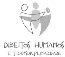
Figura 1 - UnB Notícias , 2025.