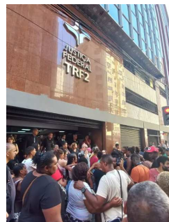
Fotos da sessão de julgamento da CSF/TRF2 e dos moradores da Ocupação Zumbi dos Palmares na porta do Tribunal, respectivamente.

A participação nas etapas dos incidentes das Comissões de Soluções Fundiárias, seja nas visitas técnicas, em uma ação no território, ou nas sessões no Tribunal de Justiça, trazem elementos para reflexão do estudante ou pesquisador quanto ao funcionamento do Direito e do sistema jurídico.