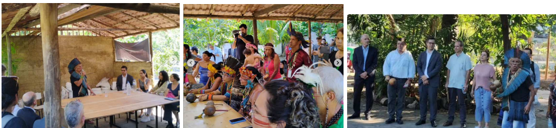
Fotos da visita técnica da Comissão de Soluções Fundiárias do Tribunal Regional Federal da 2ª Região (CSF/TRF2) na Aldeia Maracanã.

No caso da Aldeia Maracanã e da Ocupação Gilberto Domingos, o NAJUP Luiza Mahin esteve presente nas reuniões prévias com os relatores dos incidentes, auxiliando na construção do roteiro prévio, nos dois casos, assim como também participou da Assembleia da Gilberto Domingos, de explicação e organização da visita.