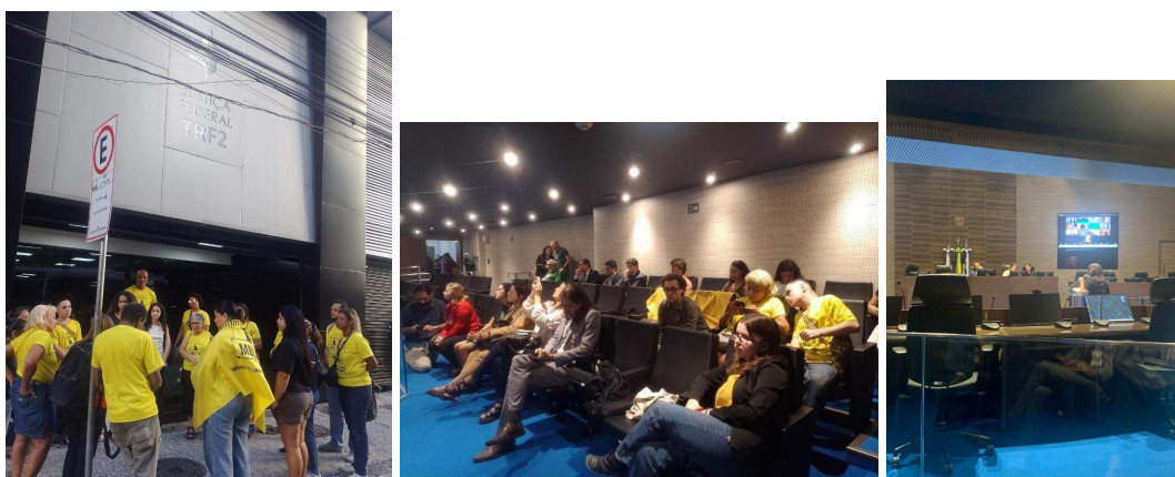
Fotos dos moradores e do NAJUP Luiza Mahin acompanhando sessão de julgamento da CSF/TRF2 e fazendo uma conversa posterior de repasse do que foi decidido na ocasião.

Esses elementos da atividade presencial assumem contornos de rica análise a respeito de uma cultura jurídica própria, como diria Frederico Almeida (2010) ou mesmo de um habitus dos atores de justiça, nas práticas mantenedoras das relações hierarquizantes produzidas na sociedade (Bourdieu, 2004).