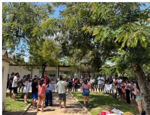
Imagem: Encerramento do Encontro Nacional da RENAP. Outubro de 2025. Salvador, Bahia. Itapuã.

Assim, findou-se o encontro não como um fechamento, mas como um potente ponto de partida. A Rede se despediu com o coração cheio, a mente alerta e as mãos calejadas, reafirmando o compromisso de construir, na prática e ao lado do povo, os trilhos concretos da justiça social e os passos firmes da liberdade.