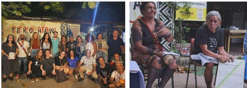
Fotos da roda de conversa de leitura coletiva da Cartilha sobre as Comissões de Soluções Fundiárias na Aldeia Marakanã.

DIREITOS HUMANOS E TRANSDISCIPLINARIDADE