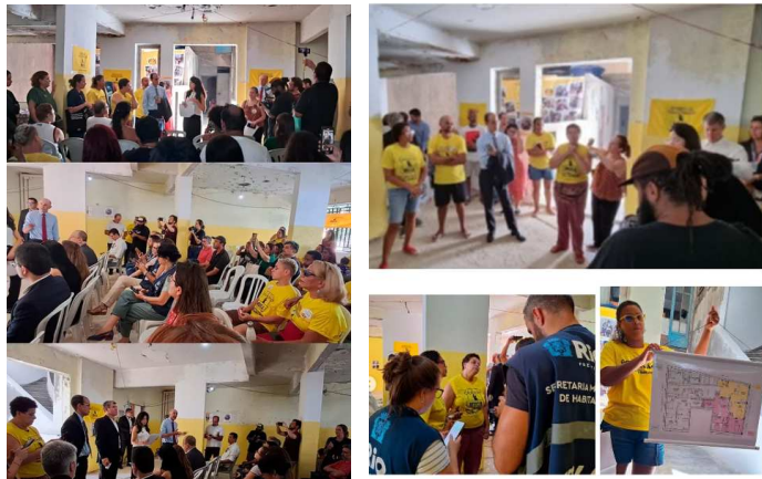
Fotos da visita técnica da Comissão de Soluções Fundiárias do Tribunal Regional Federal da 2ª Região (CSF/TRF2) na Ocupação Gilberto Domingos.

No caso da Aldeia Maracanã e da Ocupação Gilberto Domingos, o NAJUP Luiza Mahin esteve presente nas reuniões prévias com os relatores dos incidentes, auxiliando na construção do roteiro prévio, nos dois casos, assim como também participou da Assembleia da Gilberto Domingos, de explicação e organização da visita.