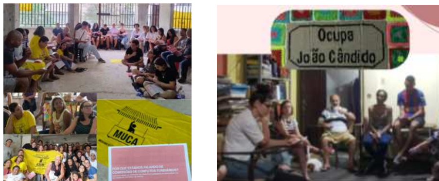
Fotos da roda de conversa para leitura da Cartilha “Porque estamos falando de Comissões de Soluções Fundiárias?” na Ocupação Gilberto Domingos, do Movimento Unido dos Camelôs (MUCA) e na Ocupação João Cândido, no Movimento Quilombos Urbanos, respectivamente.

Está entre os pilares que guiam os trabalhos da assessoria jurídica popular a discussão conjunta com a comunidade e com os movimentos sociais das estratégias jurídico-políticas para as conquistas de um determinado direito ou objetivo (Campilongo, 2009). Para tanto, é fundamental que exista um processo de compreensão e envolvimento das famílias no curso processual.