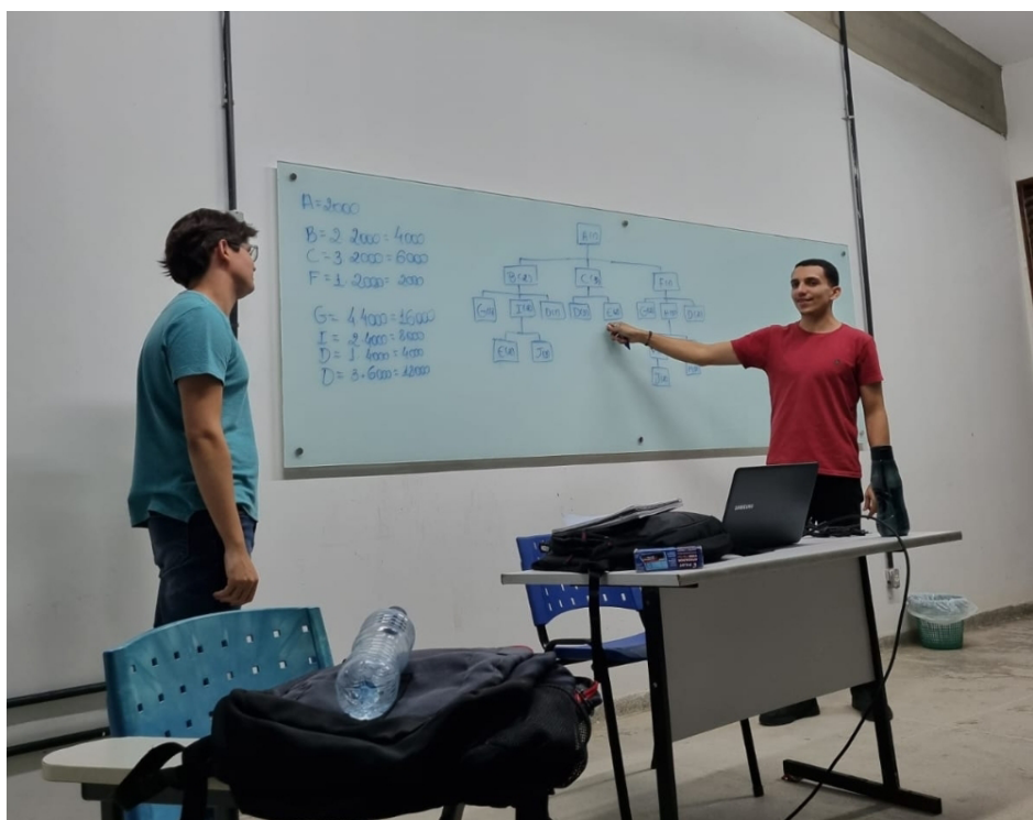
Imagem 1 - Sessão de monitoria

O projeto proporcionou aos monitores uma visão além de estudante, permitindo o desenvolvimento de competências como didática, planejamento e elaboração de material para os monitorados, essenciais para condução de cada sessão de monitoria (Imagem 1). Essa experiência permitiu a aplicação de abordagens de ensino adaptadas às necessidades dos alunos, o que, conforme Gonçalves et al. (2020), potencializa a melhoria no ensino de graduação e articula teoria e prática.