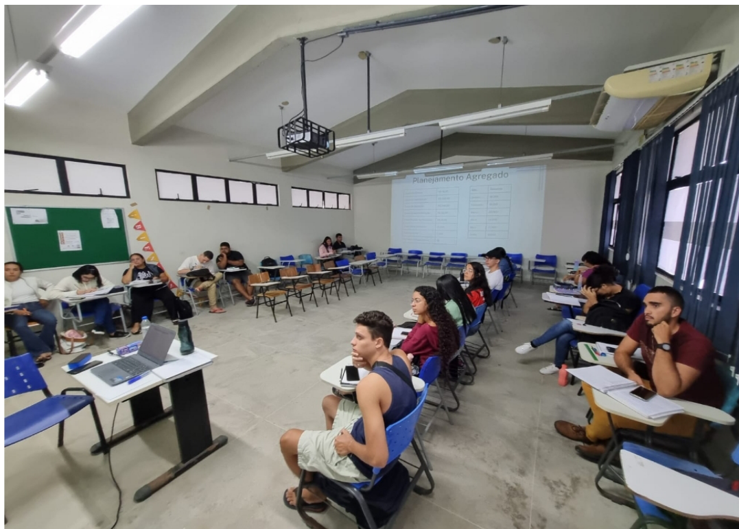
Imagem 2 - Estudantes praticando exercícios propostos na monitoria