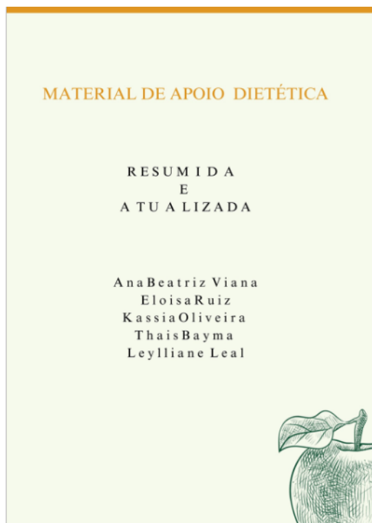
Figura 1: Material de apoio.