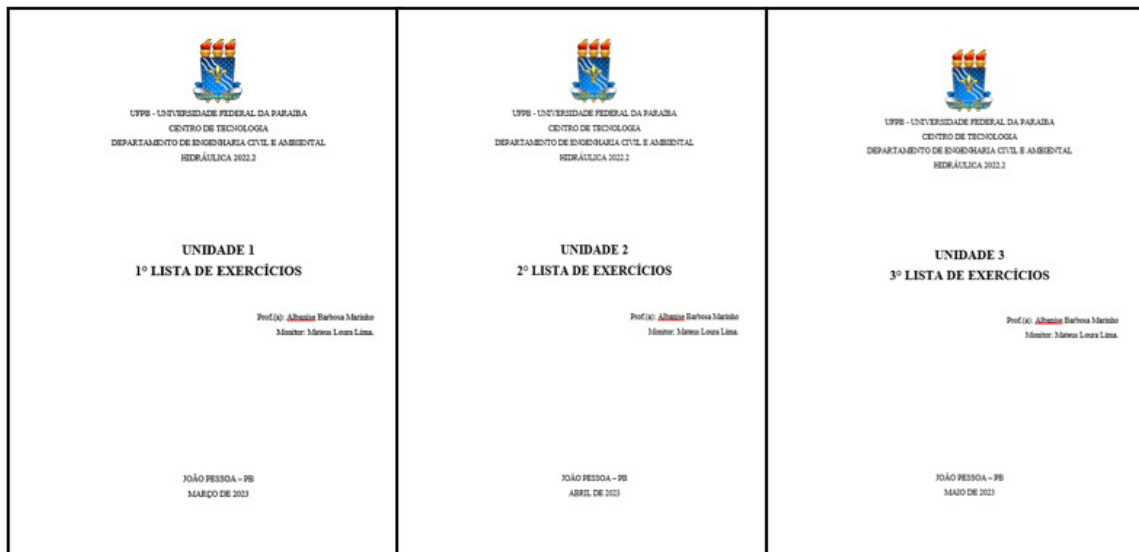
Figura 1: Capa das listas de exercício de todas as unidades

As aplicações dos testes rápidos, com caráter teórico do conteúdo, foram realizados nos dias das aulas de revisão e exercícios, conduzidos pelos monitores, com pontuação de 0,5 pontos. As questões tinham, como objetivo de incentivar os discentes para ler e revisar o material didático e teórico apresentado pela professora. Os questionários eram criados antecipadamente no site do Plickers, os quais permitiram a inscrição gratuita. (Figura 2).