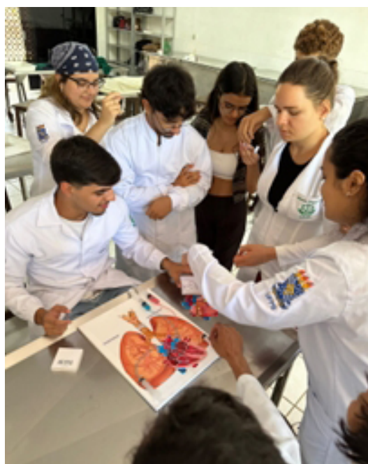
Figura 1: Aplicação do material produzido no laboratório de anatomia

Essa validação trouxe grande satisfação, pois percebe-se que foram atendidas as expectativas estabelecidas e contribui-se para o aprendizado dos discentes. Essas experiências e aprendizados não só enriqueceram a formação acadêmica do tutor, mas também moldaram a visão sobre o papel do educador, mostrando que o ensino é uma via de mão dupla, onde tanto alunos quanto tutores crescem juntos.