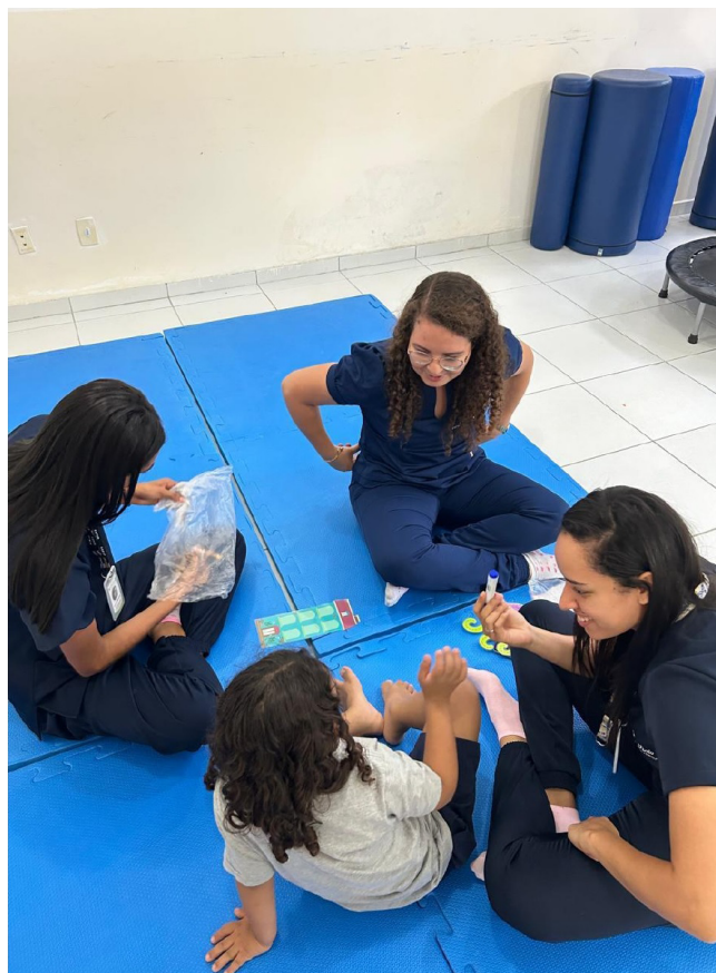
Imagem 2 - atendimentos Individuais