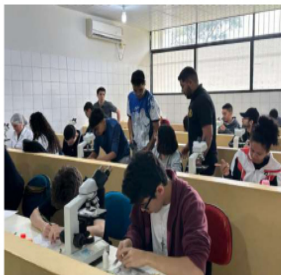
Figura 1 – Acompanhamento e auxílio nas aulas práticas.

Do ponto de vista profissional, a experiência deu ao monitor, uma visão prática de como atuar em posições que envolvem gestão de pessoas e processos de ensino. Esse contato direto com os alunos fortaleceu habilidade de identificar e atender diferentes estilos de aprendizagem, o que contribui na formação profissional do monitor.