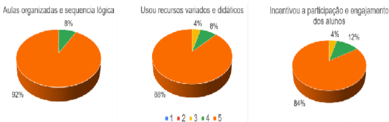
Gráfico - 2

1 - discordo totalmente 2 - discordo 3 - neutro 4 - concordo 5 - concordo totalmente