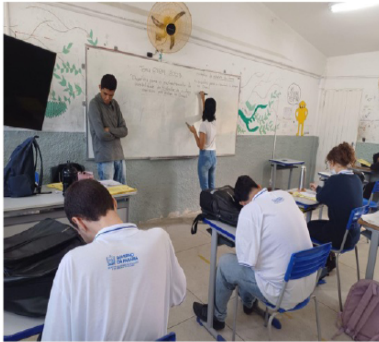
Imagem 2 - Discentes do projeto em atuação na escola ECITFAC