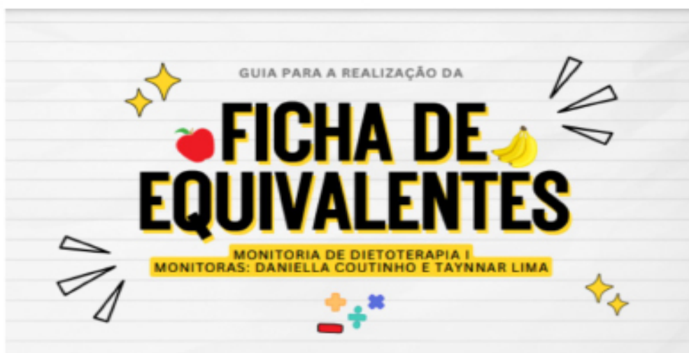
FIGURA 1 - Capa do Manual

Por fim, nenhum dos alunos sugeriram melhorias (Figura 2), indicando uma satisfação geral. Em resumo, o manual foi bem recebido, com boa clareza, estrutura e aplicabilidade, embora haja espaço para melhorias em termos de exemplos mais diversificados.