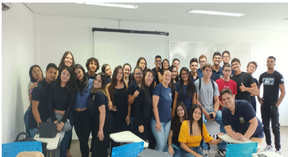
Imagem 1 – Finalização da turma do período 2023.2.