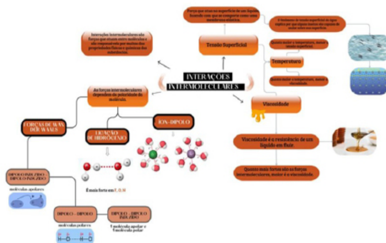
IMAGEM 2 – Mapa conceitual produzido pela tutora Alessandra