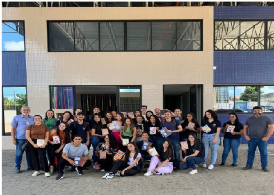
Imagem1. Visita a empresa CADERSIL