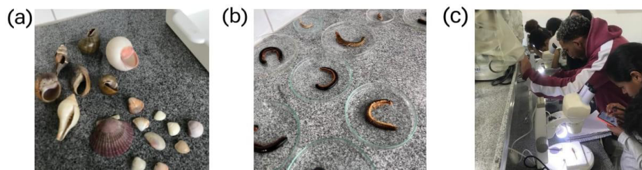
Figura 1 - Atividades realizadas na disciplina de Zoologia dos Invertebrados II. (a e b) Preparação das aulas práticas; (b) Aula prática.

Os métodos de avaliação utilizados englobaram exercícios aplicados nas aulas práticas, apresentação de seminários e provas realizadas ao longo de cada unidade. Essas estratégias possibilitaram uma avaliação efetiva do desempenho da turma na disciplina, além de proporcionar uma visão sobre a assimilação do conteúdo. Os resultados aqui discutidos são parciais, tendo em vista que a disciplina ainda está em andamento.