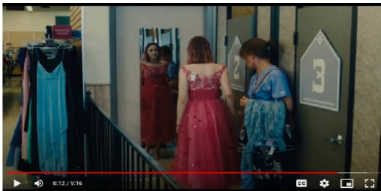
Figura 2 - Cena recortada para Análise Fílmica