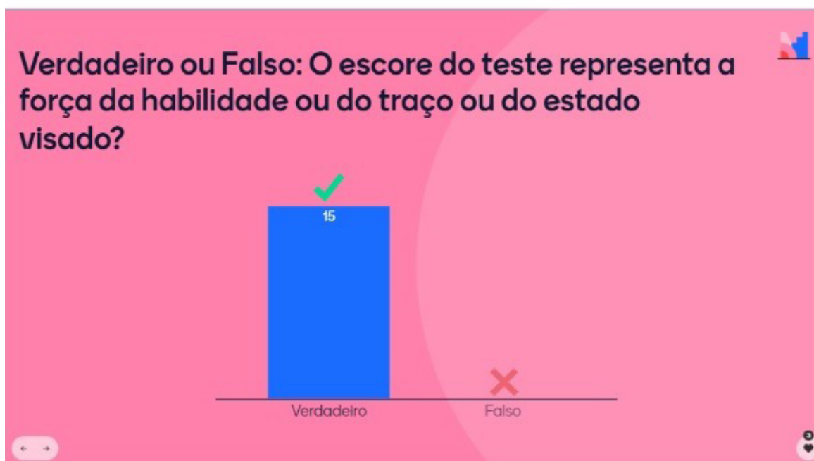
Figura 1 – Dinâmica de fixação de conteúdo.