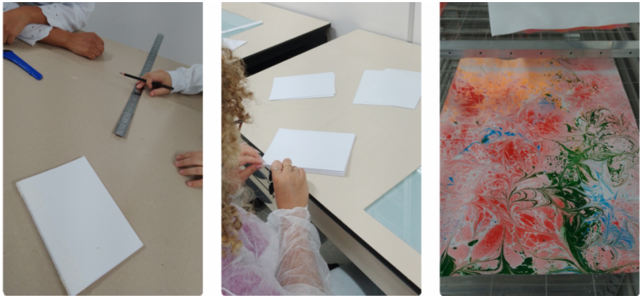
Elaboração das/dos autoras/es, 2024