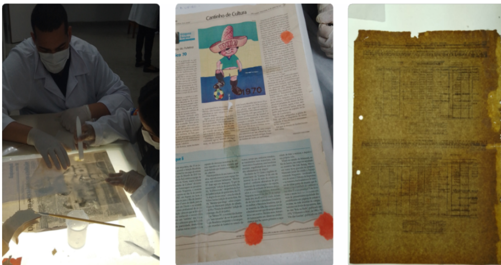
Imagem 4 - Pequenos reparos: obturação, enxerto e velatura