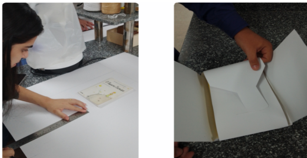
Imagem 6 - Acondicionamento