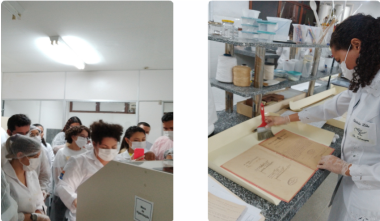
Elaboração das/dos autoras/es, 2024