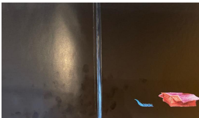
Figura 3: Guarda Final