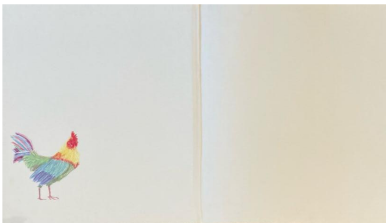
Figura 2: Guarda Inicial

Com isso em mente, o leitor é convidado a inferir novos sentidos a partir das guardas. Ambrose e Harris (2009, p. 75) citam que as guardas são papéis cartão colado no início e no final de um livro, unindo o bloco de texto à encadernação da capa. Em algumas obras, podem apresentar ilustrações decorativas. Nos livros literários, especificamente do segmento infantil, as imagens presentes nas guardas desdobram novas camadas interpretativas do texto, assumindo uma função estética e não apenas decorativa. Em “O Galo Garnizé”, temos a seguinte experiência: