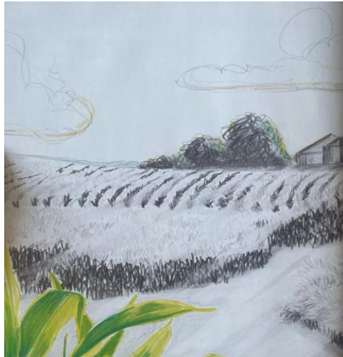
Figura 6: A fazenda