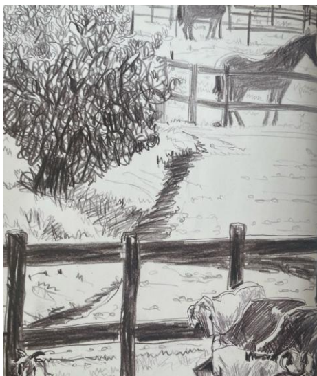
Figura 5: Ambientação da fazenda

Em diálogo com essa apresentação, há uma ilustração, na página anterior, que representa os cercados onde os animais vivem. Como se vê abaixo: