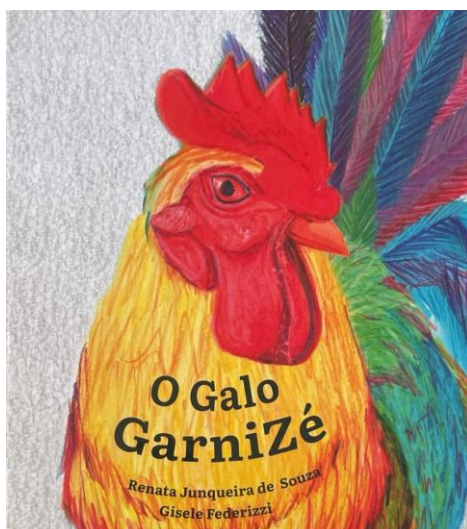
Figura 1: Capa

Nesse sentido, os elementos paratextuais convidam o leitor a mergulhar no universo narrativo que é a história do galo Garnizé. Assim, a “capa” apresenta a imagem do galo em destaque e o mesmo está em uma posição de repouso. O galináceo possui a crista e o pescoço em vermelho e em amarelo, já o corpo tem cores vibrantes e é colorido, como se vê na figura abaixo: