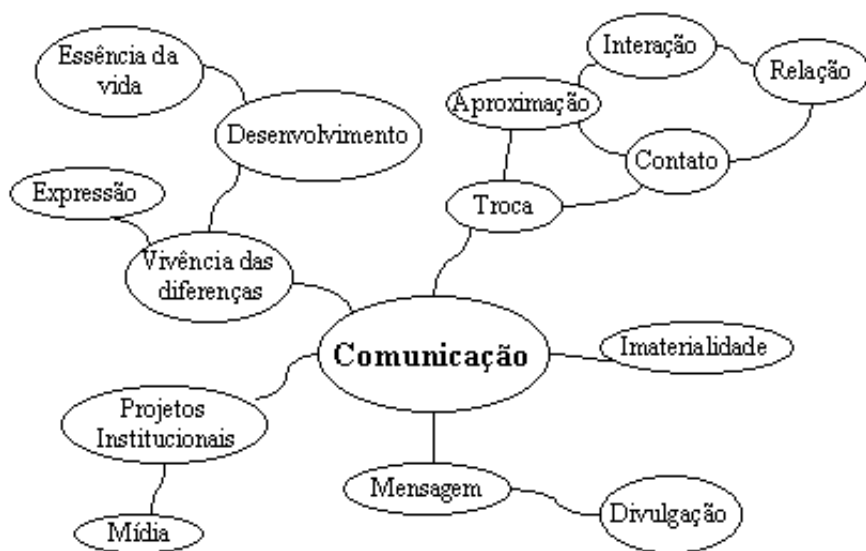
Fig.3 - Representação Conceitual - Comunicação

Para o universo das ONGs, a idéia de comunicação é aquela que talvez melhor expresse os seus objetivos e os meios empregados para atingi-los: a ação interativa com as camadas populares e o trabalho que se elabora em relação a conhecimentos, linguagens e falas que não possuem o mesmo estatuto na sociedade.