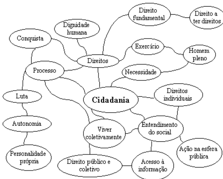
Fig.4 - Representação Conceitual - Cidadania

As representações realizadas pelos agentes das ONGs acrescentam novos elementos e chaves de entendimento aos conceitos de conhecimento, comunicação e informação, expressando uma situação que Foucault (1971, p. 256) chamaria de confronto entre o discurso teórico – ou “espaço transcendental sem sujeito” – e o discurso prático, onde o sujeito se faz presente, suas “relações de forças e combates”, suas falas e representações.