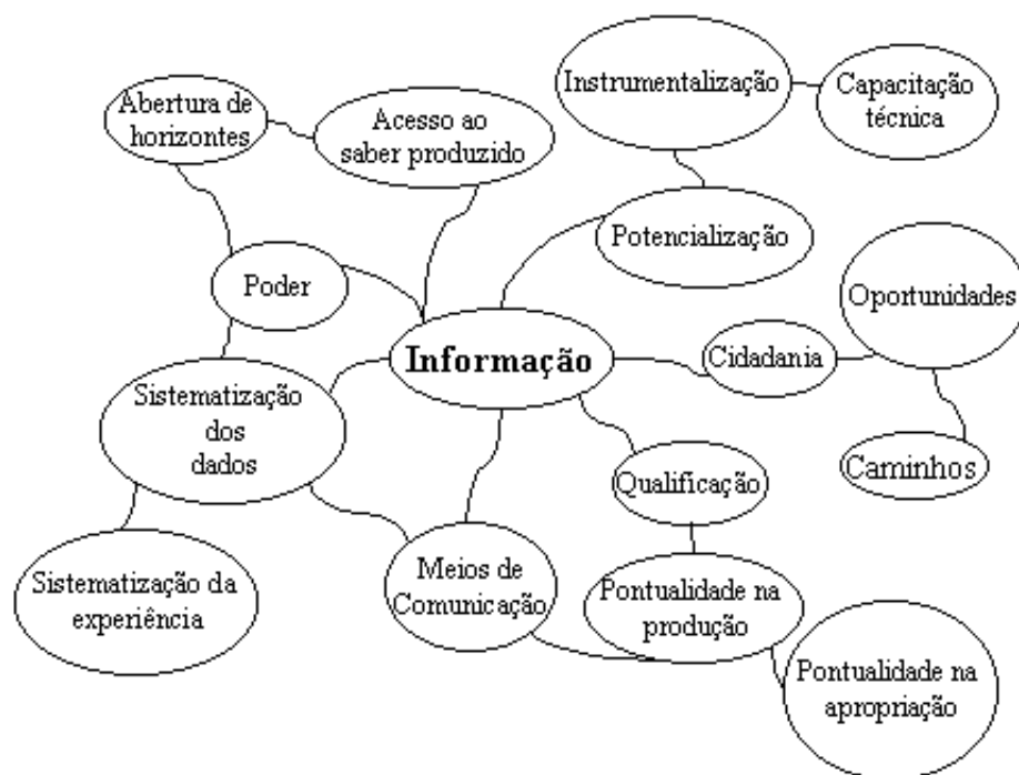
Fig. 2 - Representação Conceitual - Informação

A informação, a depender desses mecanismos de ordem cognitiva, pedagógica e instrumental, "abre caminhos", "cria novos horizontes" para a conquista dos "direitos da cidadania" e de "acesso ao saber produzido". Assim como o conhecimento, informação está relacionada ao poder. Sua disponibilidade, acesso e absorção pelos agentes sociais agregam valor ao conhecimento por eles/neles incorporado, isto é, enriquecem e potencializam suas ações sobre a realidade, pois a informação permite a sistematização dos dados objetivos e exteriores aos agentes, e aqueles extraídos da sua própria experiência.