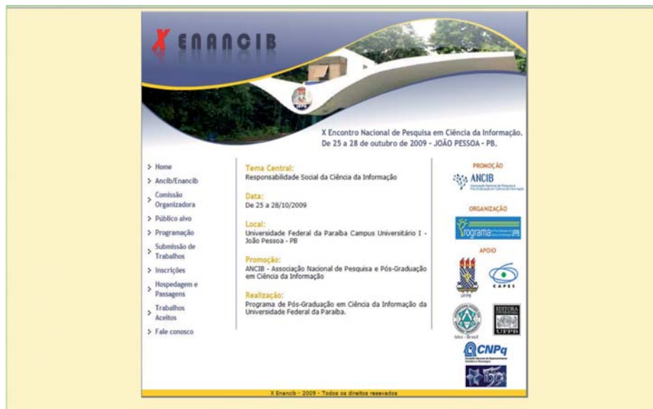
Figura 1: Sítio do X ENANCIB na web.

da ANCIB e dos ENANCIBs, programação acadêmica e cultural, Comissão Organizadora, regras para submissão de trabalhos, informações e formulário para inscrição e outras), o qual se encontra hospedado permanentemente no servidor do CCSA da UFPB, onde, também, estão disponíveis os Anais do X ENANCIB contendo todos os trabalhos aceitos para apresentação nos GTs (comunicações e pôsteres) 3 .