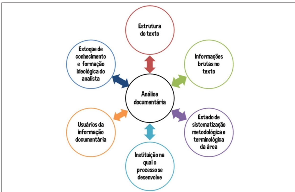
Figura 1 – Variáveis do processo global da análise documentária propostas por Lara (1993)