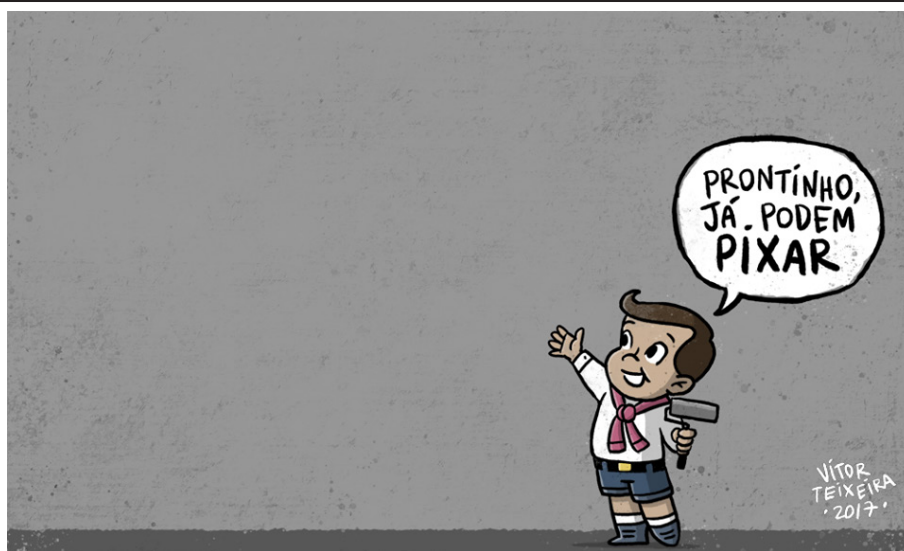
Figura 3 – Prontinho, já podem pixar, por Victor Teixeira

Fonte: TEIXEIRA, Victor. Prontinho, já podem pixar . 2017. Disponível em: < https://www.facebook.com/vitortcartoons/ >. Acesso em: 21mar. 2017.