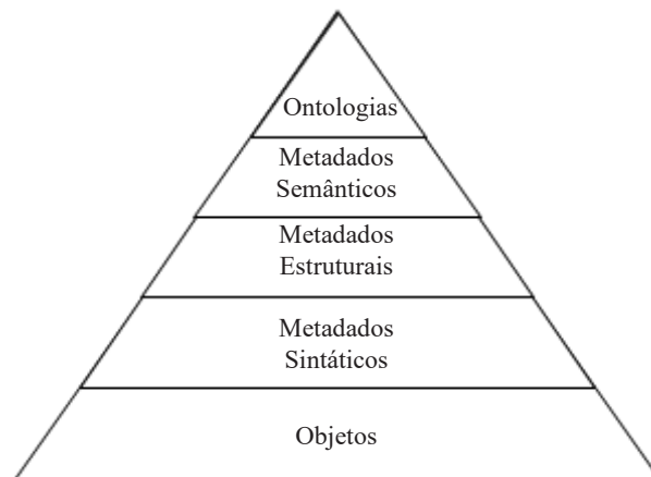
Figura 1 - Tipos de Metadados

Os vocabulários podem, ademais, ser utilizados por domínios semanticamente mapeados, constituindo-se então como ontologias. Sobre as ontologias, Chu afirma que “ podem ser vistas como um vocabulário controlado universal para representação de recursos no web ” (CHU, 2010, P. 277, tradução nossa) e, para González, “ é uma descrição explícita e formal de conceitos em um domínio de discurso, propriedades, atributos e restrições sobre as facetas ” (GONZÁLEZ, 2014, P. 76). As ontologias de domínios, de modo a representar seus objetos e relações, utilizam modelos conceituais com base em vocabulários semânticos para descrever os mais variados aspectos de forma e conteúdo dos objetos de informação. De acordo com a OEG, em 2020 mais de 700 vocabulários foram mapeados como recursos a serem aplicados aos mais diversos contextos descritivos. Com isso, estes vocabulários podem ser considerados metadados de alto nível, ou metadados semânticos, conforme a figura 1: