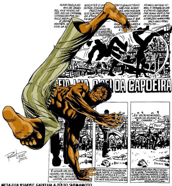
Figura 2 – Murilo Meia-Lua, o rei da Capoeira