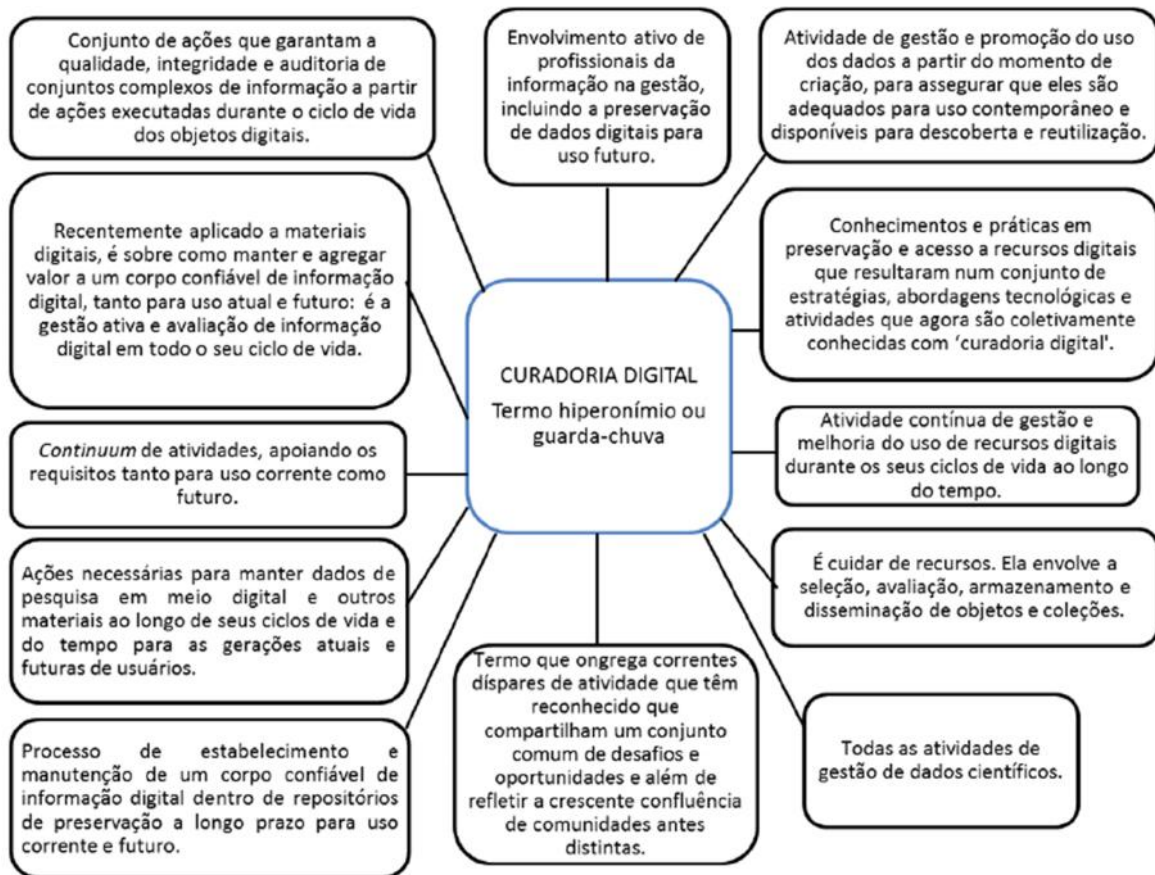
Figura 1 – Definições para Curadoria Digital

Sobre o conceito de curadoria digital, Lee e Tibbo (2011, p. 126) também o definem como um conceito amplo (conceito guarda-chuva) que abrange atividades de diversas profissões, instituições, atores e setores. De fato, de acordo com Dallas (2007), a curadoria digital representa um importante conceito na teoria e gestão da informação, devido a sua aplicabilidade frente a uma gama de problemas e domínios advindos de acervos do patrimônio cultural, e-science , mídias sociais e a gestão dos registros organizacionais.