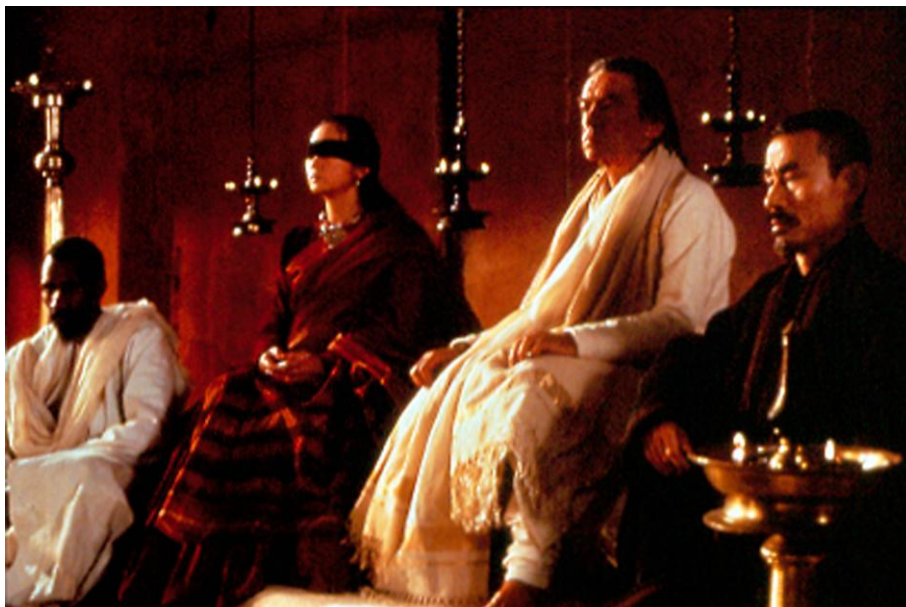
Figura 3: Sotigui Kouyaté, Mireille Maalouf, Vittorio Mezzogiorno e Yoshi Oida, em cena do filme

Passado ao crivo do cinema, as vozes se acalmam, entram em cena os sussurros. E tudo se reverte: o teatro na carrière deixava como lembrança, de O Mahabharata , um espetáculo verdadeiramente no exterior (falésia, céu, terra, odores), o cinema narra o interior, como se fosse ele mesmo o lugar de intimidade do teatro. (THIBAUDAT, 1990, s/p)